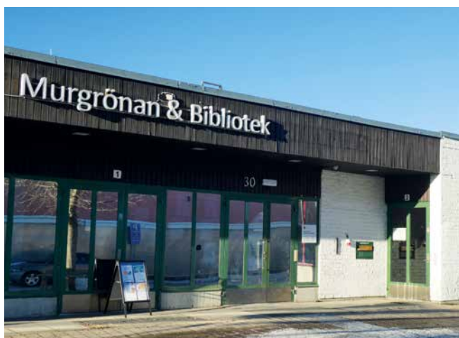
Murgrönan idag. Vad kommer sen?

– Jag fortsätter som ordförandekandidat till Kultur och fritidsnämnden. Det är stimulerande även om drömmen om en föreningsplats inklusive en hall som ger plats för musik, dans, teater och idrott har fått skjutas på framtiden när pengarna gått åt till annat.