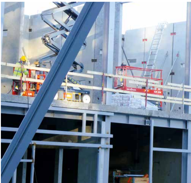
Nya skolan i Fågelsången växer fram.

– Jag har ett samhällsintresse och vill bidra där jag kan. Så när våra två barn nu börjar bli i den ålder då föräldrarna kan få lite andrum ser jag fram emot det här uppdraget. Jag kommer att fortsätta driva de frågor vi Socialdemokrater gjort hittills. Vi vill att alla elever ska få de förutsättningar som krävs för att de ska trivas i skolan och lyckas med sina studier. En bra förskola och skola är ju grundläggande för barns förutsättningar i livet.