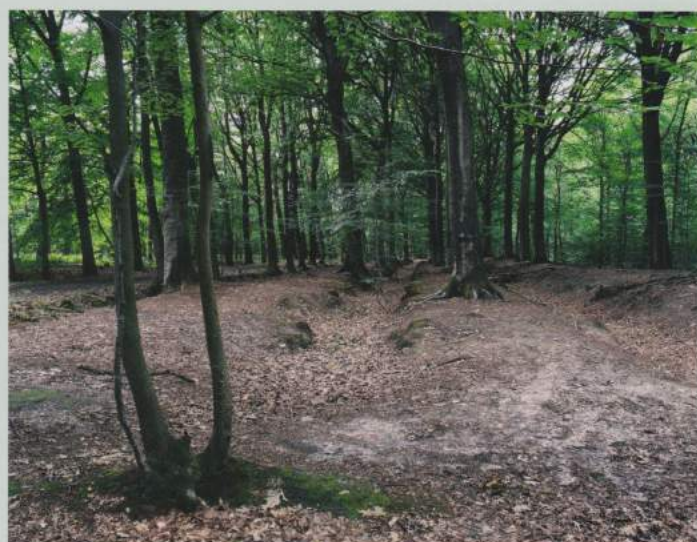
In de vijverrelicten kweekte men vroeger haring.

een vroegere aanvoerroute van zeevis vanuit de kuststreek. We nemen links de haakdreef en volgen dan even de knooppunten (27, 26, 1, 2 en 20).