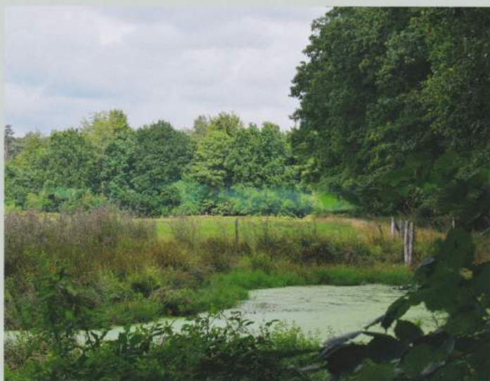
Veedrinkpoelen bevatten het hele jaar door water.