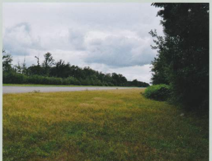
Het vliegveld van Ursel ligt er verlaten bij vandaag.