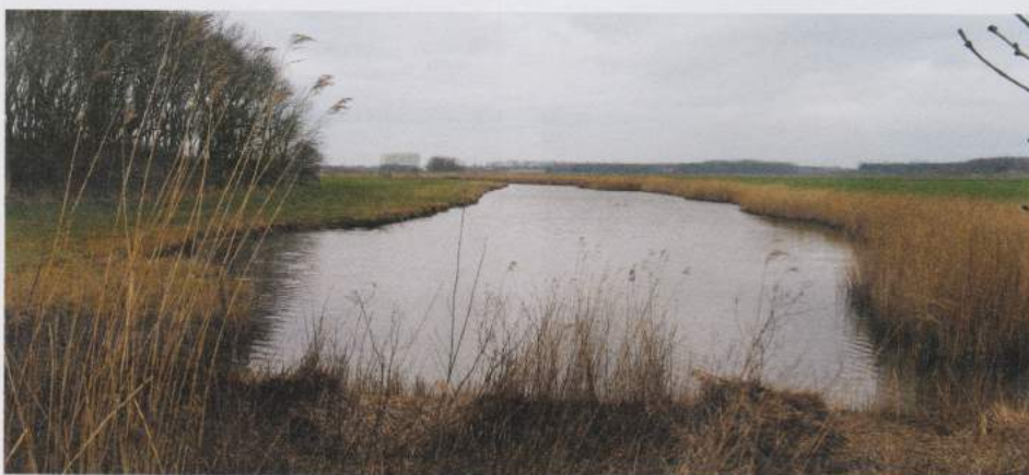
Kreken en polders tussen het Zwin en Sint Anna ter Muiden.

Als aanvulling op de Streek-GR gaven De Smokkelaars de publicatie 'Kringwandelingen op de Uilenspiegelroute' uit. De brochure bevat twintig wandellussen met een afstand tussen 12 en 25 km, die deels op de bewegwijzerde route lopen. Waar ze ervan afwijken, staat het aangegeven in de routebeschrijving. De lussen bevinden zich steeds op één van de drie routevarianten. Je kan de publicatie bestellen bij De Smokkelaars en desgewenst afhalen op onze Nationale Wandel- en Fietsdag op zondag 29 oktober. ●