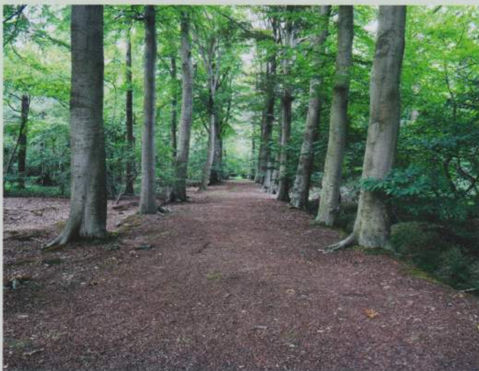
We wandelen door majestueuze dreven.