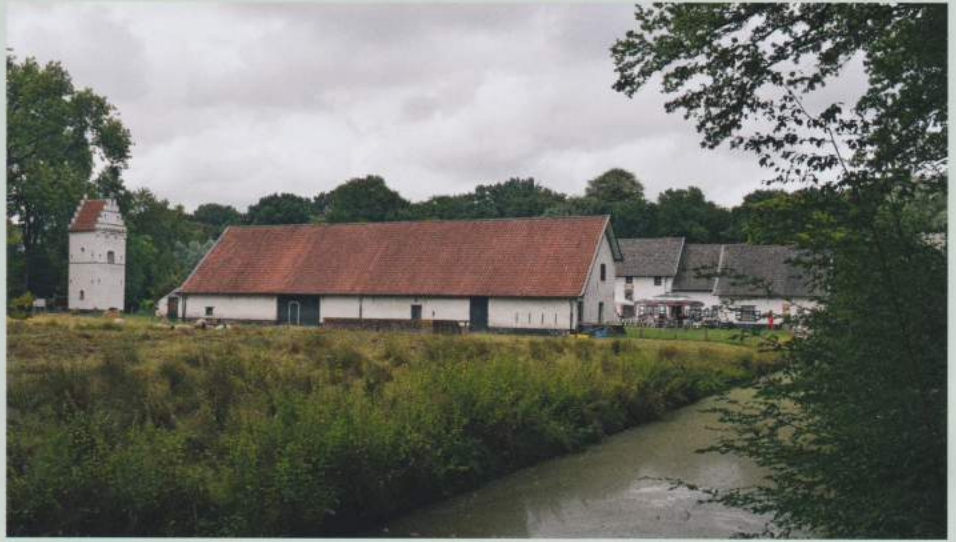
Een zicht op de Drongengoedhoeve.

We gaan links en dadelijk weer rechts, zodat we opnieuw aan de landingsbaan komen, waar we weer links gaan, tot we aan het Jagershof belanden.