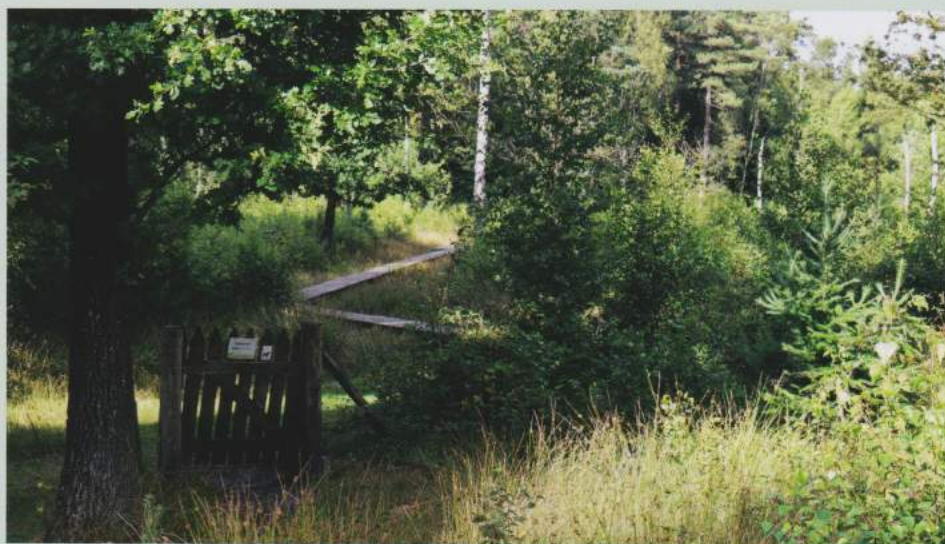
Een van de vele knuppelpaden in het Maldegemveld.

Even voorbij de huidige hoeve passeren we een infobord (zo staan er wel meer in heel het Drongengoed). Hier stond blijkbaar de oorspronkelijke Drongengoedhoeve, gebouwd door de paters en