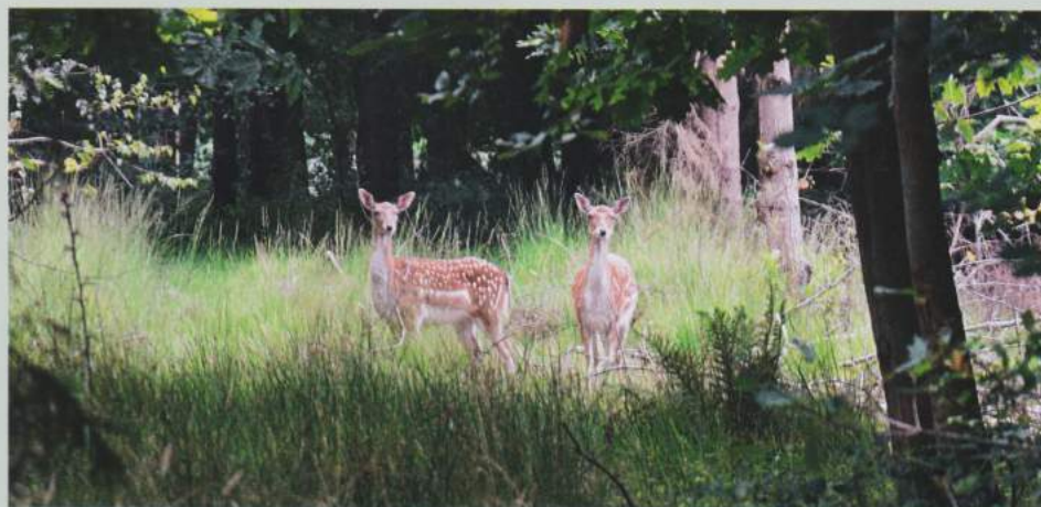
Enkele reetjes blijven gewillig maar alert poseren voor onze lens.

We verlaten de parking en gaan linksaf op het fietspad naast Kleitkalseide, om al vlug rechts het paadje richting KP 28 te nemen. Als we aan het einde weer rechts gaan, belanden we aan de abdijhoeve van Papinglo.