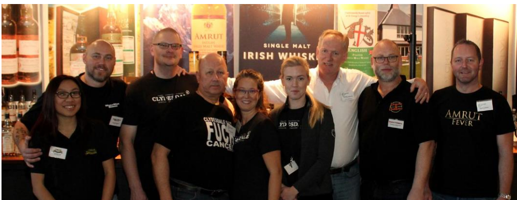
The extended team