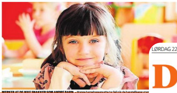
MERKES AT DE IKKE SNAKKER SOM ANDRE BARN. - Mange barnehageansatte tar feil i når de basert på barnets uttrykk mener de stammer.

På barnehagelærerstudiet får studietene undervisning i å hjelpe barn som stammer.