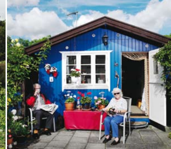
Der er god mulighed for afslapning og rekreation i en kolonihave. Her er vi på besøg i de to kolonihaveforeninger på frimærkerne, Hjelm i Aabenraa og Vennelyst i København.