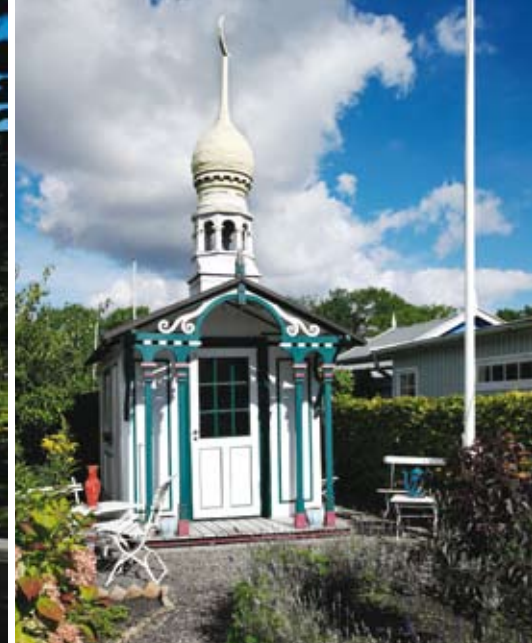
Hygge i Haveforeningen Vennelyst på Amager.