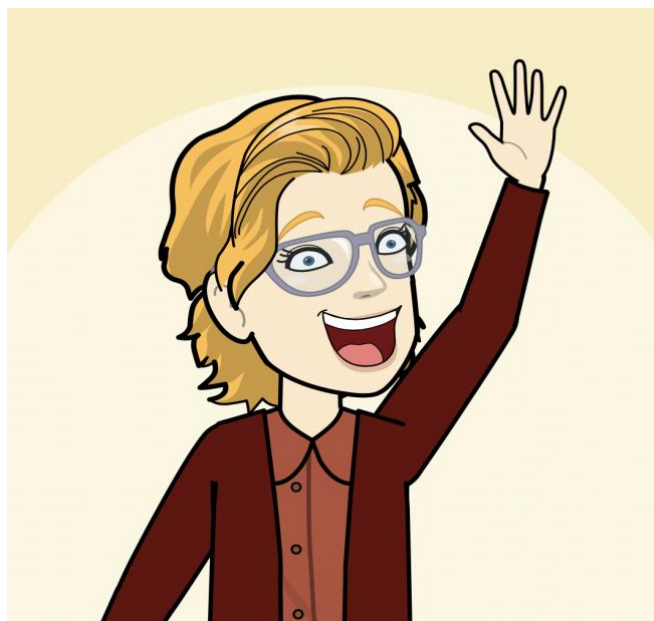
Mange tak for i dag, siger Professoren og vinker