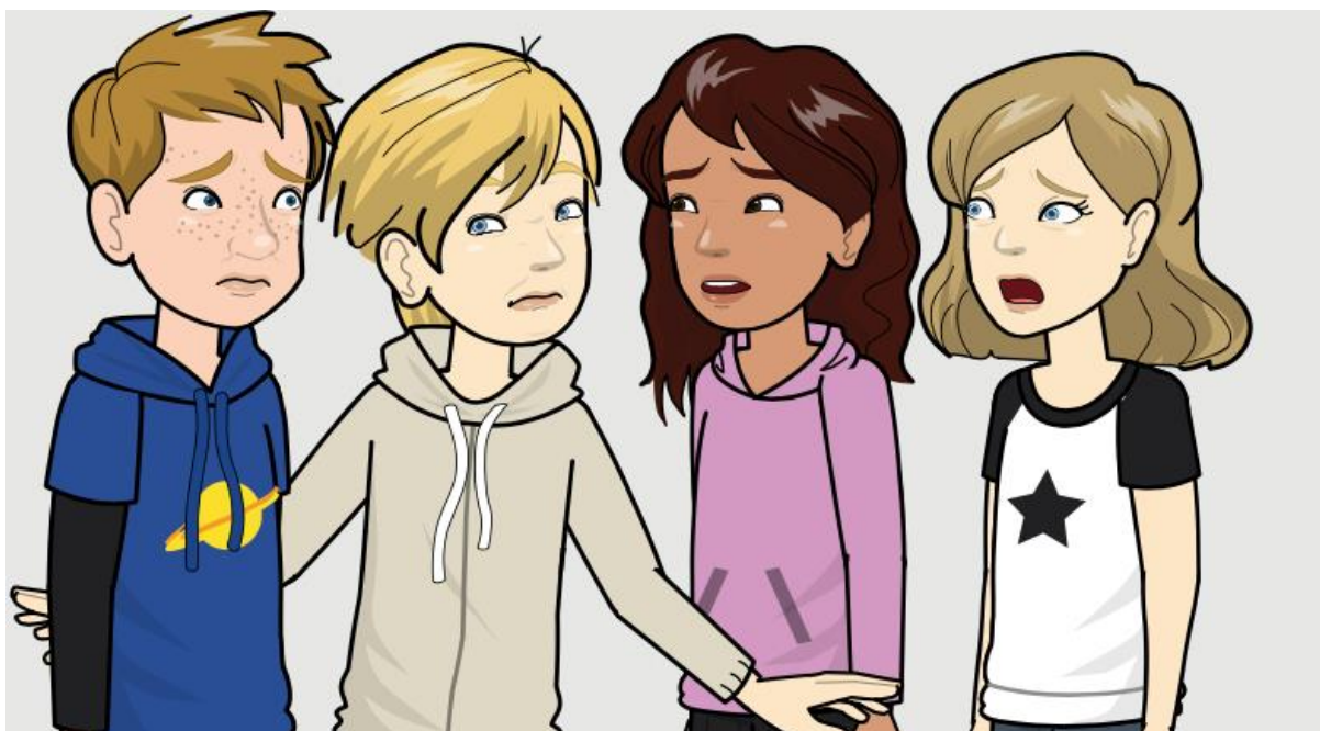
Børnene bliver mega forskrækkede, da Professoren råber BØH!