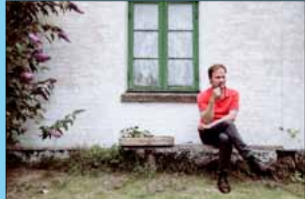
Knud Romer - forfatter, debattør, radiovært og forhenværende reklamemand. Pressefoto