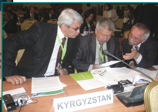
The Association's General Director in MCED-6 in Astana