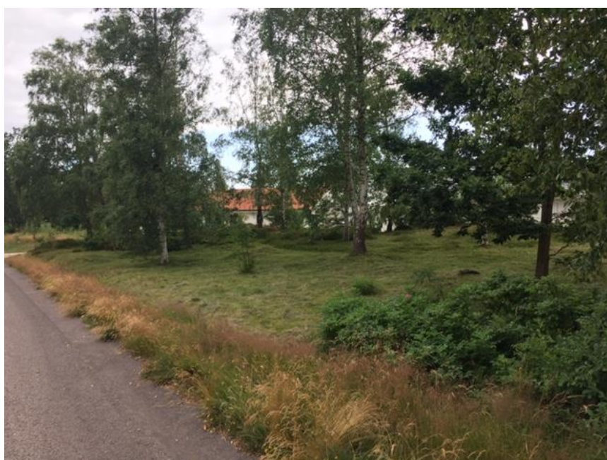
Figur 2. Exempel på god skötsel och lämplig målbild av den allmänna marken inom Skipås 25:27 utgör området mellan Skipås- och Mejselvägen. Sly och gräs röjs regelbundet medan lägre dungar av buskage och

Mekanisk lövslyröjning (sly=vedväxter upp till och med 10 cm i stamdiameter i brösthöjd) har regelbundet genomförts inom området av entreprenörer. Av olika anledningar har dessa insatser inte varit heltäckande eller inte genomförts med förnöjsamhet av de boende. Det är också en kostsam insats. Ett flertal områden inom samfälligheten är idag starkt igenväxta av sly. Samtidigt finns det flera områden som frivilligt sköts föredömligt av de boende i närområdet. I skötselplanen föreslås hur samfällighetens på ett flexibla sätt och med sannolikt högre måluppfyllelse kan ta ansvar för skötseln.