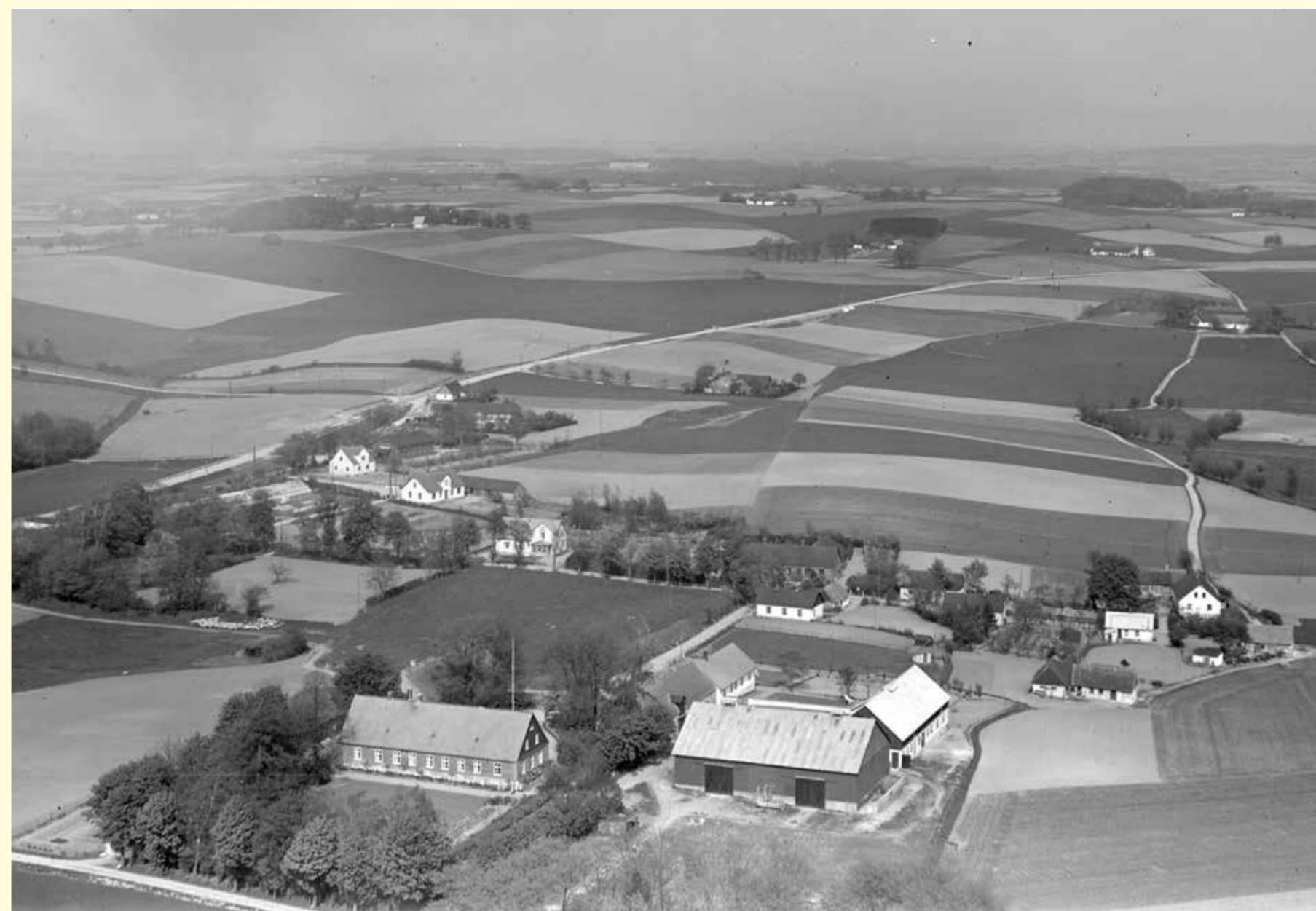
Flygfoto Sjörup 1956 KM 85976.11701