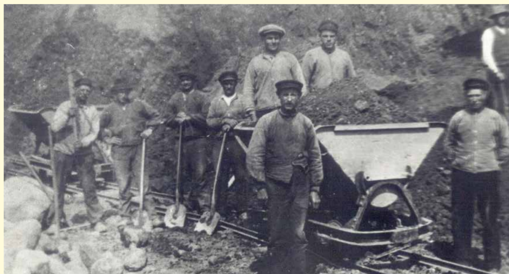
Utgrävning av Klockarebacken 1923

Sockens enda fasta fornlämning är "Sjörupstenen" som Carl von Linné omnämnde i sin "Skånska resa" 1749. Källor från 1600-talet anger att stenen ursprungligen stod "ett pistolskott" – ett par hundra meter – nordost om Sjörup kyrka. Kullen där den en gång stod är borta och på 1800-talet delades runstenen i sex delar och användes vid bygget av stenbron i Skivarp. 1985 hittades fem av bitarna och stenen restaurerades. Den sjätte delen återfanns aldrig. Länsstyrelsen gav då tillstånd om att flytta tillbaka stenen till Sjörup och dess nuvarande placering, 1996.