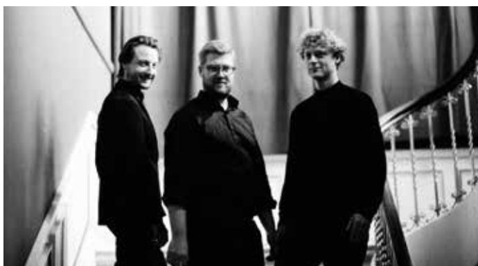
Trio Vitruvi, 2013

De første gange fandt disse koncerter sted i Restaurant Clasique på havnen, senere i Jysk Musikteater og på Gjern Bibliotek. Bestyrelsen holder løbende et vågent øre på konkurrencer i radioens P2 og forsøger at engagere nogle af de unge ensembler og solister, som har markeret sig derigennem.