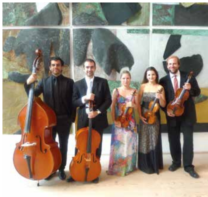
Wiener Kammerensemble, 2016