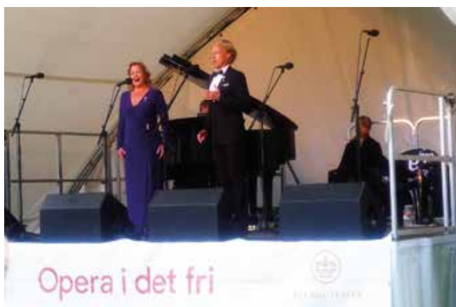
Den Kgl. Opera på KunstCentret Silkeborg Bad, 2016