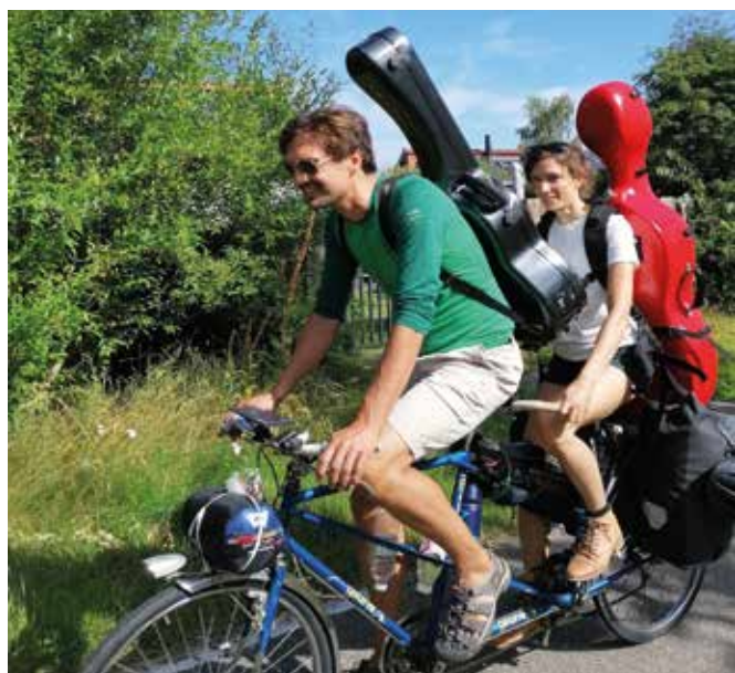
Duo på Tandem, cello og guitar, 2020