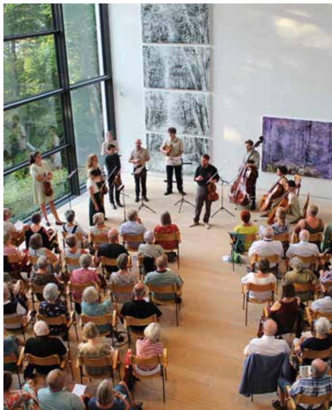
Ensemble Hermes, 2021 og 2022

Ved samme lejlighed blev foreningens vedtægter ændret, så de kom tættere på praksis. Bl.a. kan bestyrelsens medlemmer med de opdaterede vedtægter nu ikke længere modtage honorar for evt. optræden eller assistance på scenen ved foreningens arrangementer, hvilket også kun forekom i foreningens første år.