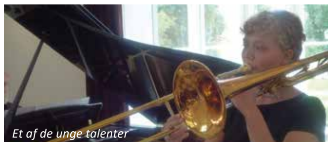
Et af de unge talenter

Dette år steg medlemstallet til omkring 70, hvilket var en fordobling i forhold til 2014.