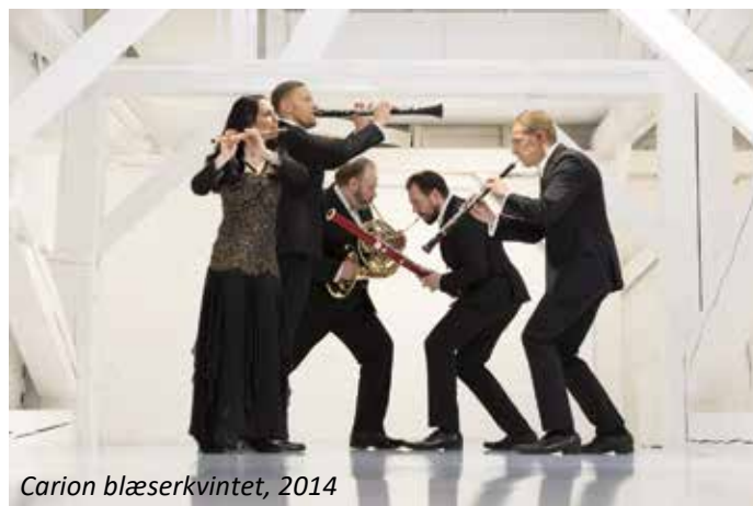
Carion blæserkvintet, 2014

Et medlemskab kostede fortsat kun 50 kr. om året for enkeltpersoner og 100 kr. for husstande. Foreningens økonomi blev sikret af sponsorer, der ud over Silkeborg Kommune overvejende talte lokale firmaer.