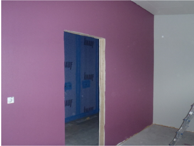
2014-08-10 Och motsvarande vägg i damernas