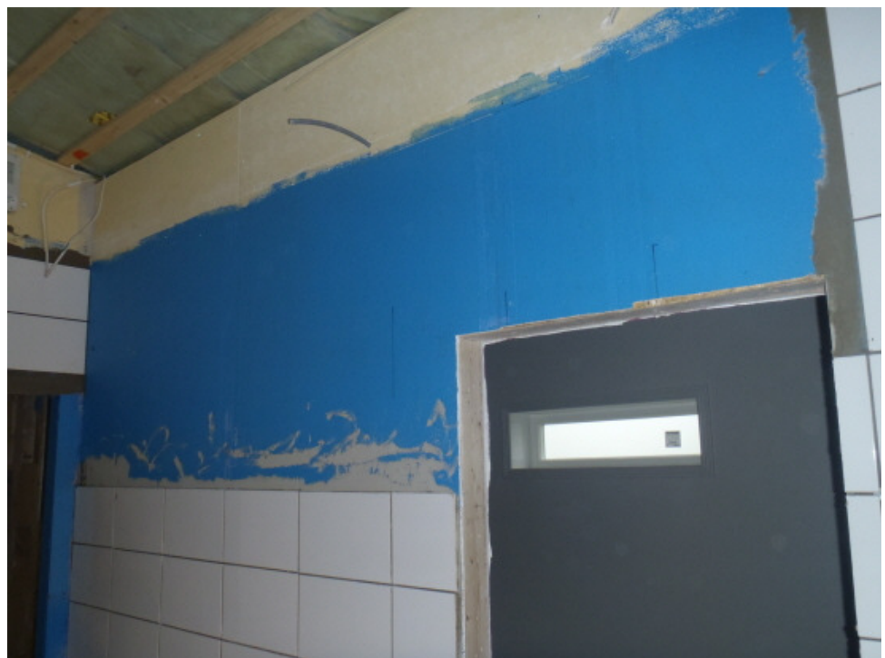
2014-08-30 Så här lite återstår innan all kakling är klar i damernas duschrum