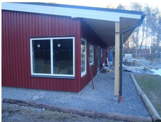
2014-03-23 Så här blir ytterhörnet med hörnfönstren på plats.