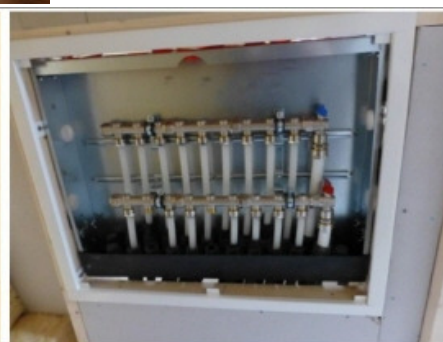
Fördelarna för kall- och varmvatten för hela huset sitter i toaletterna i herrarnas (vänstra bilden) och damernas (högra bilden) omklädningsrum. De kommer att döljas av en vitmaljerad lucka.