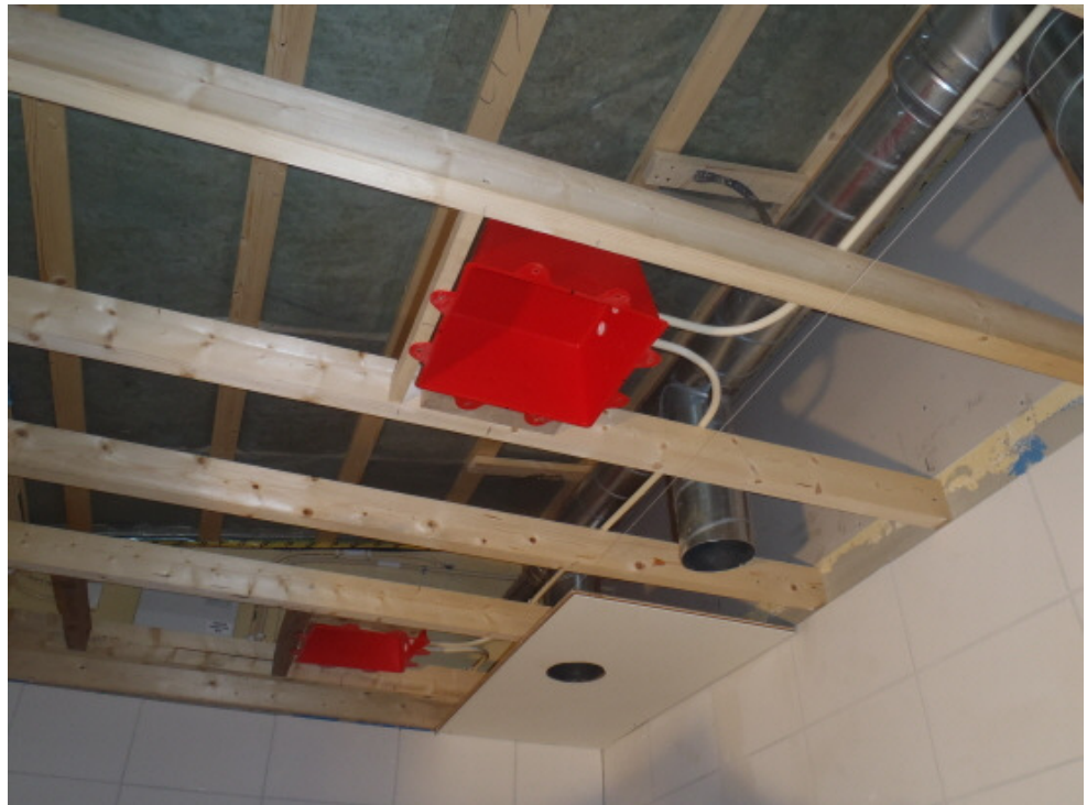
2014-09-24 Montering av takskivor i herrduschen har påbörjats