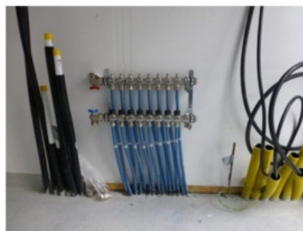
Fördelaren för golvvärmerören till omklädningsrummen och handikapptoiletten sitter iteknikrummet.