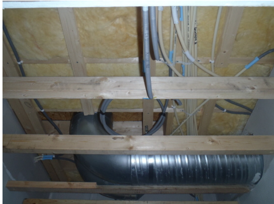
2014-10-28 Damernas skorum är också i det närmast klart. Återstår även här burk för armatur och lite justeringar av ventilationstrummorna