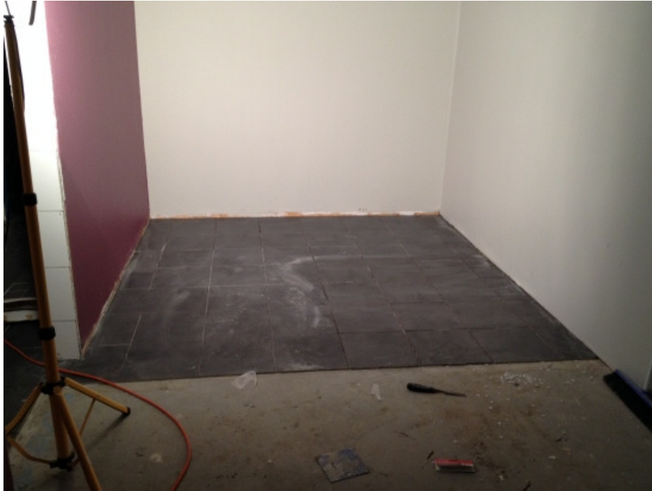
2014-10-17 Östra delen av damernas omklädningsrum färdigklickrad