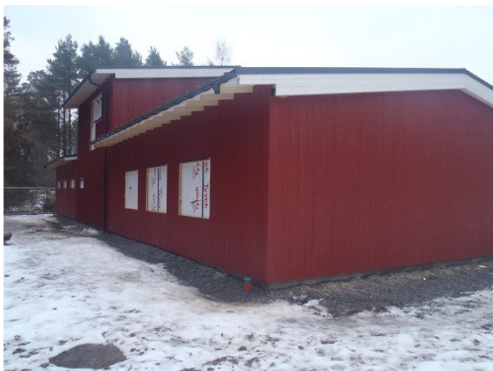
2014-02-04 Baksidan från nordvästra hörnet