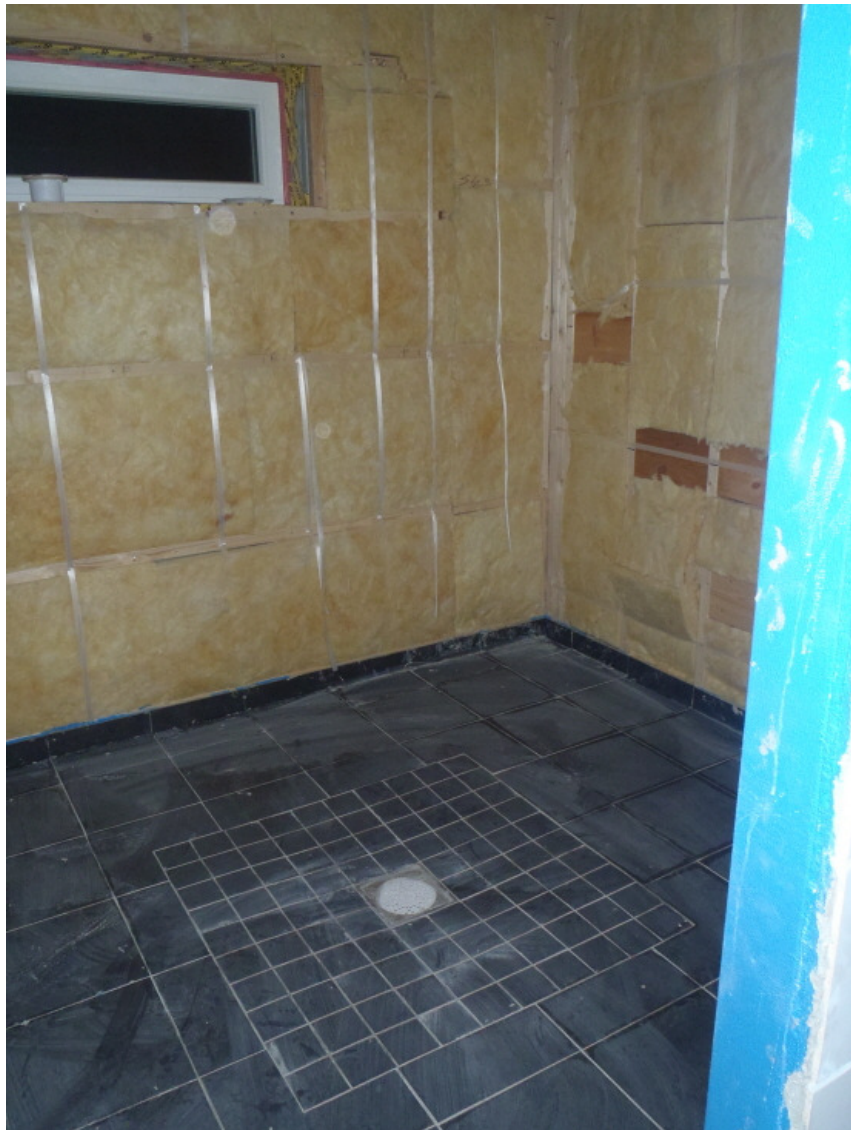
2014-10-28 Herrbastuns golv klinkrat och klart, återstår fogning (och lite klinkertvätt)