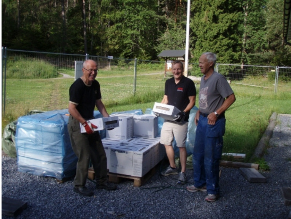
2014-07-17 Allt kakel och klinkers bars raskt in under torsdags- morgonen. Totalt 4 ton bars in i stugan så det inte skulle försvinna