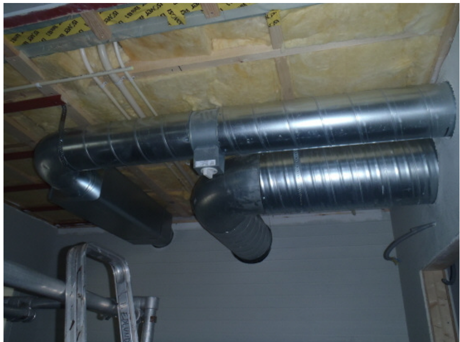
2014-08-10 Ventilationstrummorna är nu på plats i hela dusch- och omklädningsdelen. Här ser vi några i taket på damernas omkläd- ningsrum. De kommer inte att synas när vi är klara då ett innertak kommer att dölja dessa.