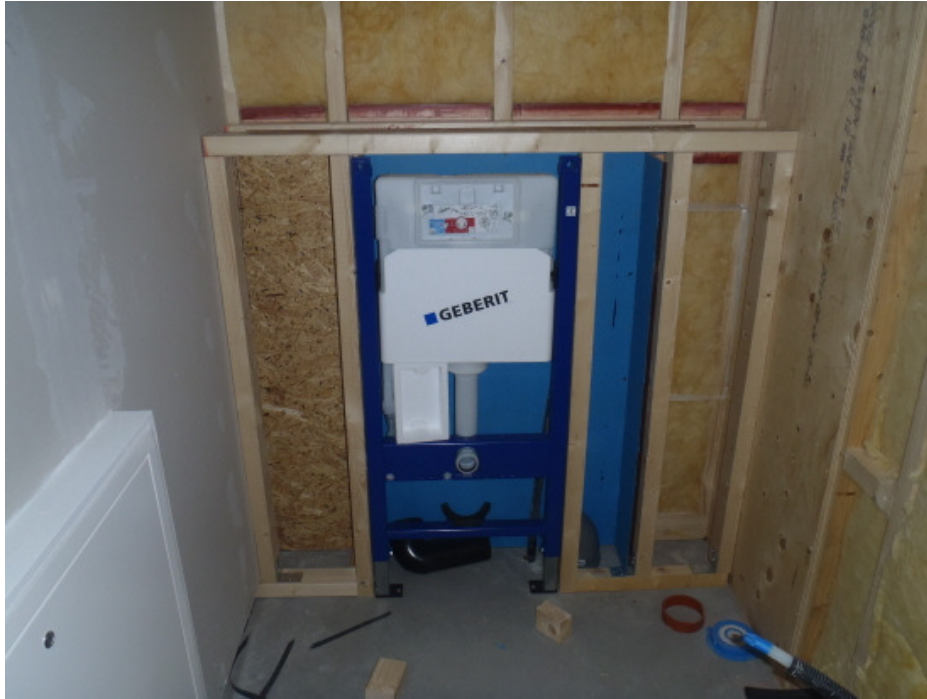
2014-09-24 Monteringen av toaletterna i omklädningsrummen går vidare