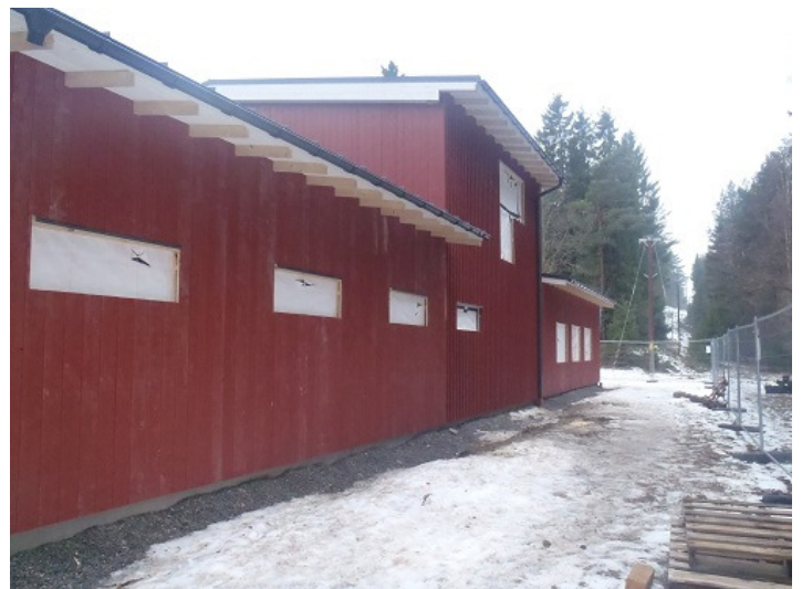
2014-02-04 Baksidan västerut. Lockpanelen på plats på högdelen innan byggställningen monterades ner. Notera också att stupröret är på plats. Övriga stuprör väntar på att lockpanelen ska komma på plats.