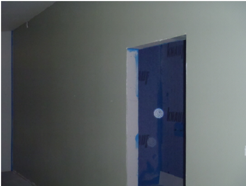
2014-08-10 Målning av omklädnings- rummen pågår för fullt. Här är en fondvägg i herrarnas omklädningsrum