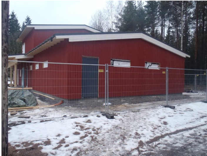
2014-02-04 Byggställningen monterades ner idag och här ser vi också att ståldörren till teknikrummet kommit på plats