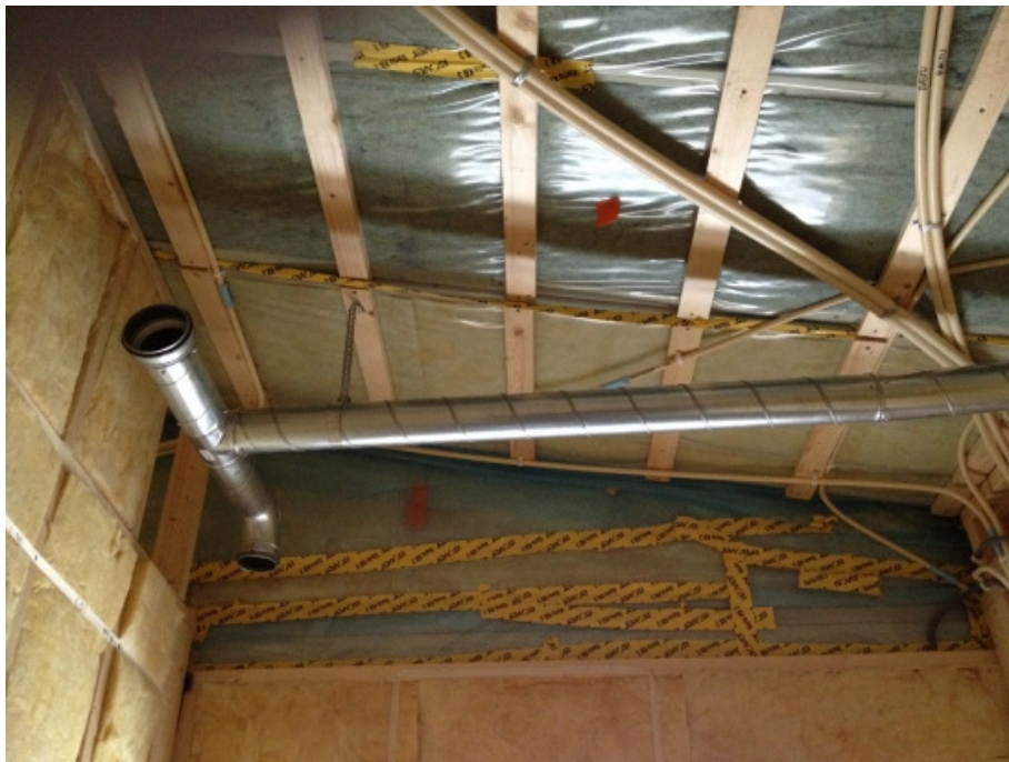
2014-07-03 Första ventilationsrören på plats, dessa går till teknikrummet och dambastun.