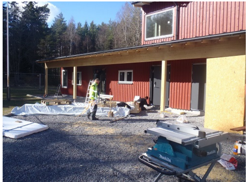
2014-03-23 WWL på plats igen. Denna gång på blixitvisit men monterade samtliga ytterdörrar och fönster. Nu är skalet tätt!