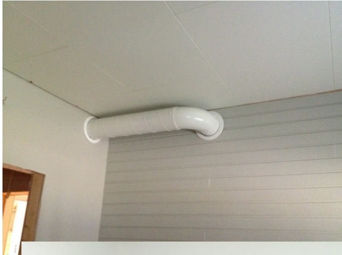
2014-09-12 Det synliga ventilationsröret i herrarnas omklädningsrum är nu målat