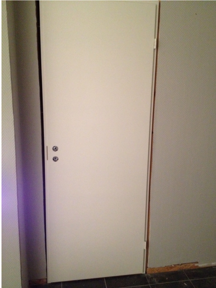
2014-12-01 Första dörrarna på plats, den här går till toaletten i herrarnas omklädningsrum