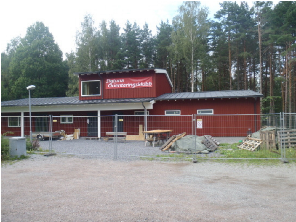
2014-08-10 Vi har satt upp en utskrift av tänkt skylt på stugan för att se att den får plats och passar. Efter beslut ska en plåtskyt beställas och sättas upp.