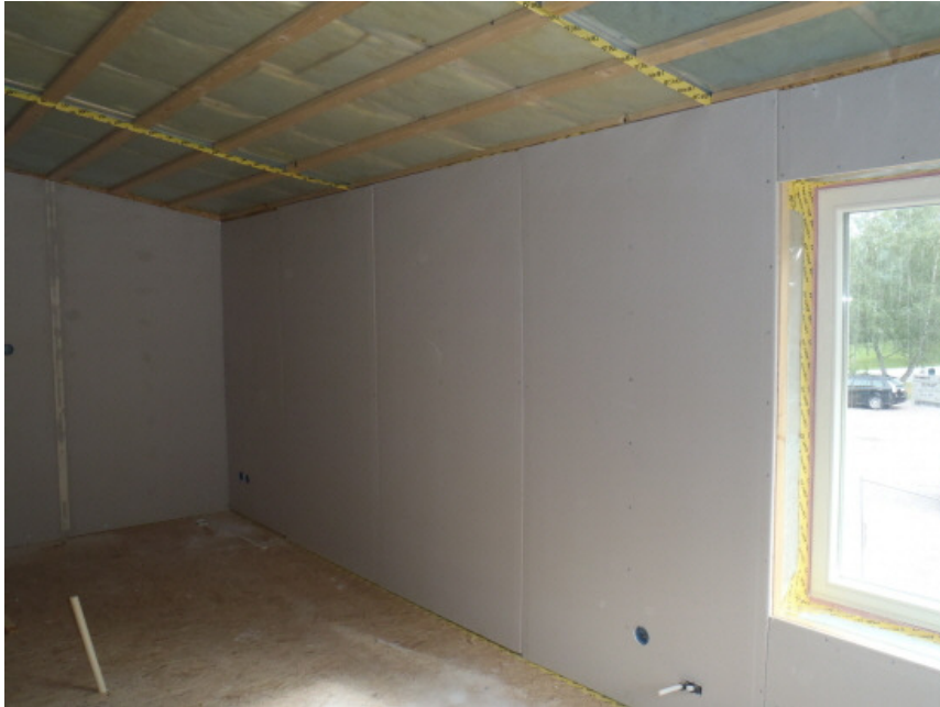
2014-08-10 Mötesrummet på övervåningen har börjat kläs med gips på väggarna