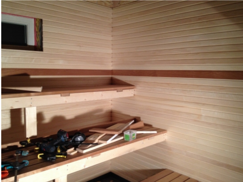
2014-11-25 Bastubyggandet börjar närma sig slutfasen