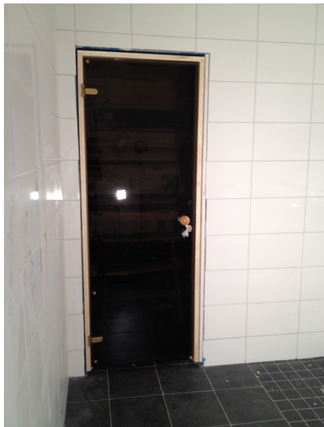
2014-12-01 Här är dörren in till herrarnas bastu. Även dambastun har fått dörr idag