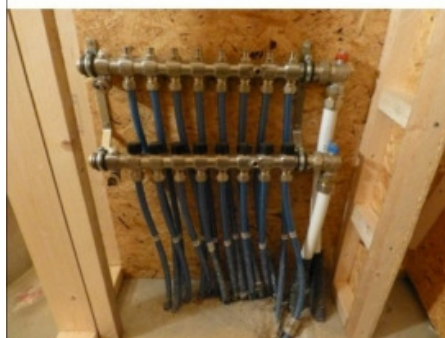
Fördelaren för golvvärmerören till entréhall, storstuga och kök sitter i städrummet.