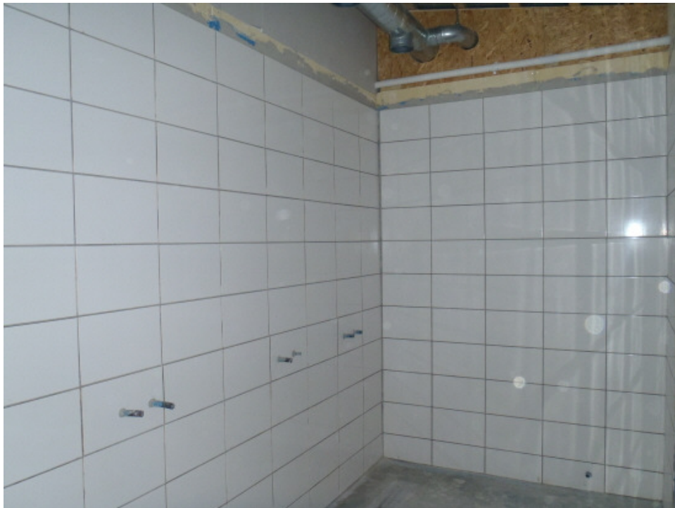
2014-08-30 Kakelsättningen i herrarnas dusch är nu helt klar. Återstår bara fogning