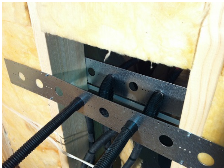
2014-04-05 Vattenrören monteras hela hela vägen för att uppfylla Säker vatten installation. Plåtarna ger automatiskt 160 c/c för att passa till duschblandaren.