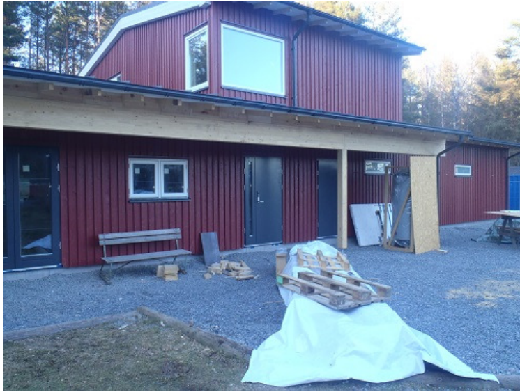
2014-03-23 Huvuddörren och dörr till HWC

2014-03-23 Alla dörrar på framsidan. Fortfarande fel färg på den franska dubbeldörren som ska vara vit. Den ska dock målas om av WWL innan man är klar med den.