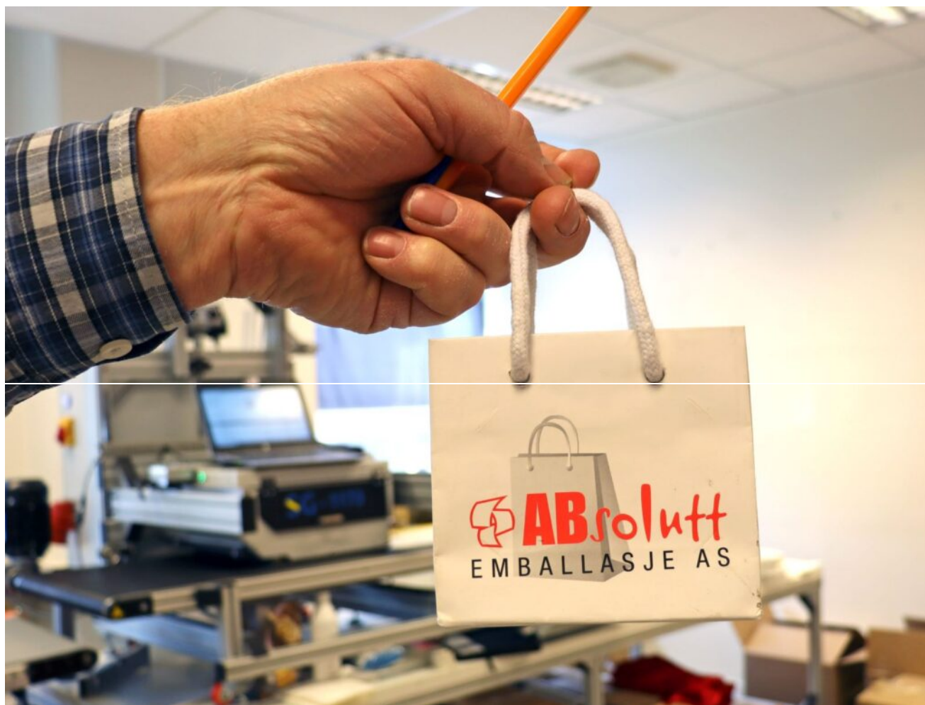
Den första påsen tillverkades i samband med lanseringen 2007.