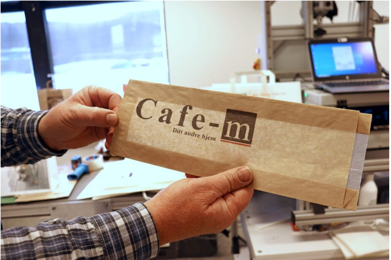
SG-1170 kan också användas för att trycka på t.ex. brödpåsar.

_ Vi tror att vi kan fylla en lucka på marknaden och erbjuda tryckta papperspåsar till företag som inte kan köpa stora kvantiteter. Vi tror att det finns en stor potential för detta", säger Trond Bu.