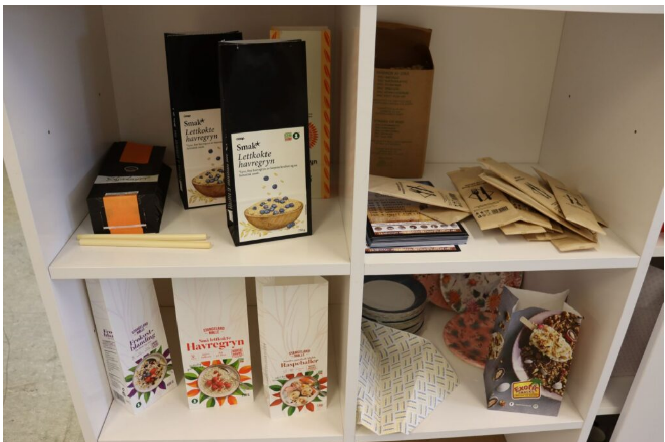
Exempel på produkter som Absolutt Emballasje importerar och säljer.