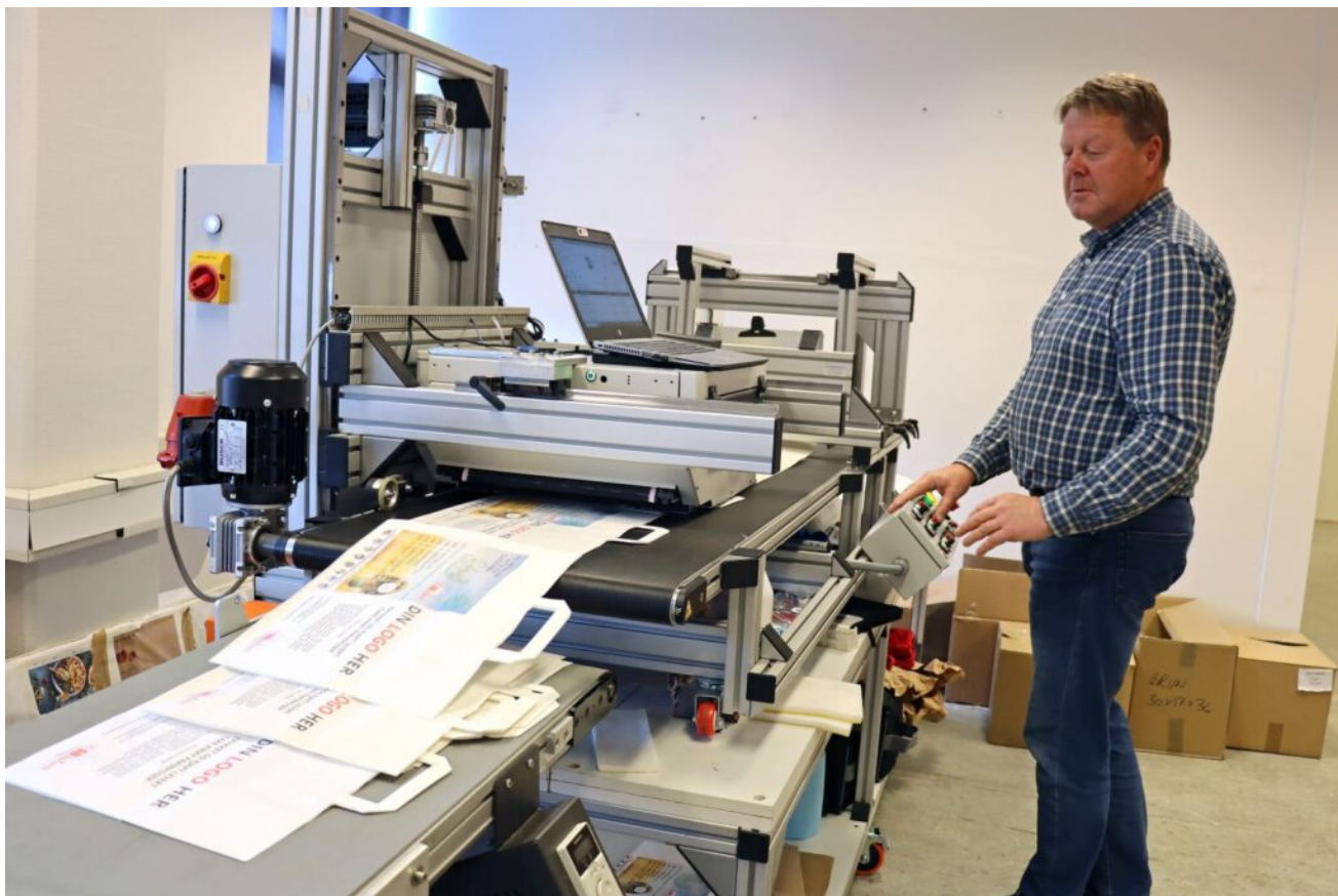
SG-1170 har ett transportband med automatisk matare. Den kan trycka tusentals produkter per timme, beroende på material.

Absolutt Emballasje grundades redan 2007, men låg vilande i många år. Trond Bu har arbetat inom pappersindustrin i 25 år och hans kollega Morten Aarnes-Jensen har också arbetat många år med försäljning inom den grafiska industrin. Tillsammans såg de en möjlighet att sälja pappersbaserade förpackningsprodukter och bidra med kunskap i länken mellan kund och tillverkare. Det var inte förrän 2020 som de återupplivade företaget mitt under en brinnande pandemi, som visade sig vara en bra tid för förpackningsföretag.