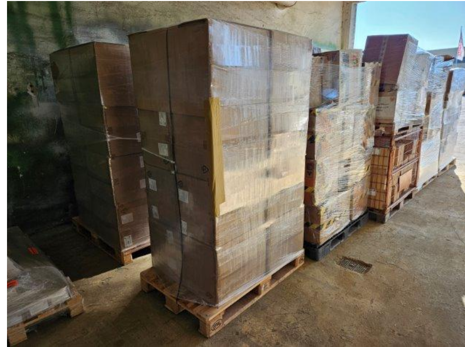
Alles muss verladen werden.