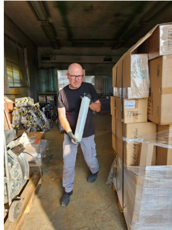
Umpacken der Paletten.