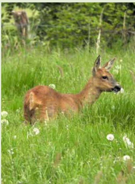
Je kunt reeën verwachten in het Spanderswoud