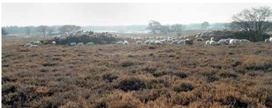
Al eeuwen lang: heide, schapen en grafheuvels

Voor velen is het zo vanzelfsprekend: even een wandelingetje op de Hilversumse hei met de hond, of een fietstochtje door de Gooise bossen. Dat er nu nog steeds ruim 2.900 hectare aan bossen, heide, oude akkers en graslanden in het Gooi aanwezig is, mag echter gerust een klein wonder heten.