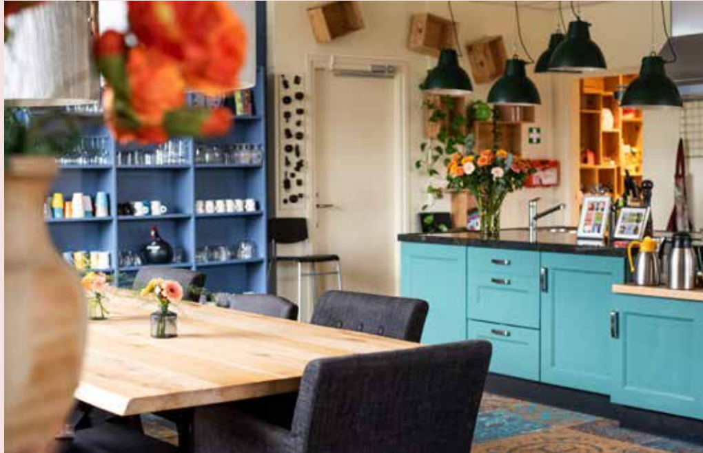
Gezellige huiskamer Viore.

Deze groep is bedoeld voor mensen van wie de partner is overleden en die graag in contact komen met anderen die dit ook hebben meegemaakt. Ook nabestaanden van partners die niet aan kanker zijn overleden zijn welkom. De groep bestaat uit 6 - 8 deelnemers van wie de partner niet langer dan (ongeveer) drie jaar geleden en niet korter dan drie maanden geleden is