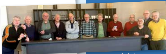
Bijeenkomst in het voor- malige KRO-gebouw, De Kroon

In het maartnummer van dit maandblad stond een oproep aan mannen binnen Senver om mee te praten over de resultaten van de enquête die in november 2023 is gehouden. Doel van de enquête was om te onderzoeken of er behoefte bestond om iets te doen aan het lage percentage mannen dat lid is van Senver. Die behoefte bleek te bestaan. Er gingen 12 mannen in op de uitnodiging om mee te denken. Begin maart hebben zij uitgebreid en creatief nagedacht over speciale activiteiten die voor mannen interessant zouden kunnen zijn. Een klein groepje heeft de resultaten geordend. En daarmee zullen de volgende stappen worden gezet. Wordt vervolgd!