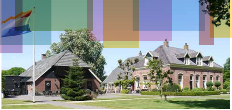
Het Oranje Museum in Diepenheim