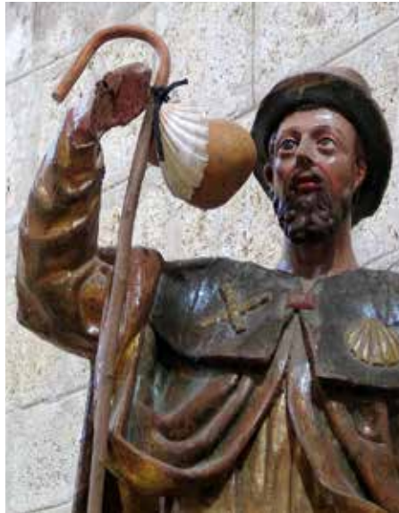
Beeld van Jacobus de Meerdere

Hij voert ons langs landschappen, steden en culturele highlights; ook maken we kennis met enige pelgrims. Alle aspecten van de pelgrimsroute zijn in beeld gebracht vanuit een kunsthistorische blik.