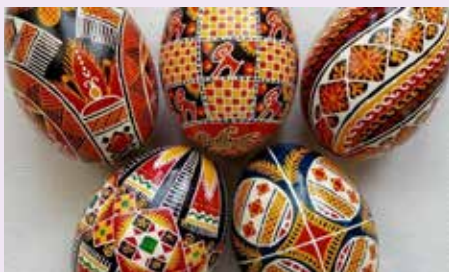
Kunstig beschilderde paaseieren uit Oekraïne

Het schilderen van eieren met Pasen is een eeuwenoude traditie, waarvan de oorsprong niet helemaal bekend is. In de vastentijd tussen Aswoensdag en Pasen mochten er lang geleden geen vlees en geen eieren worden gegeten. Daarom beschilderden mensen de eieren die in die tijd werden gelegd. En op Paaszondag mochten er eindelijk weer eitjes worden gegeten.