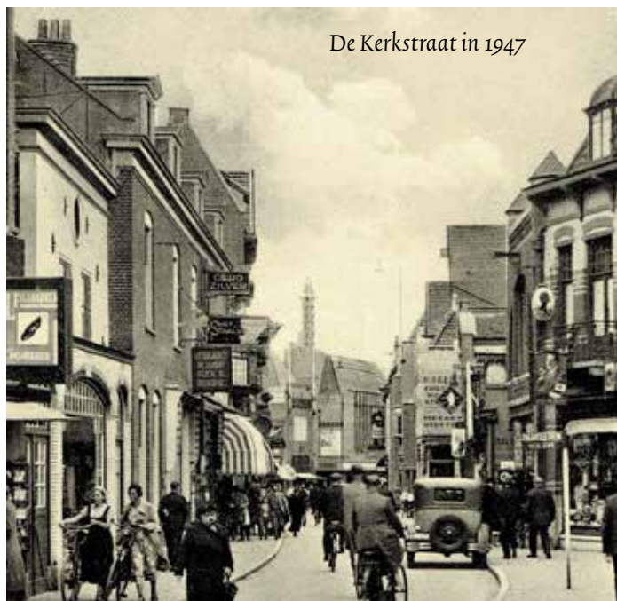
De Kerkstraat in 1947

Vanwege 600 jaar Hilversum produceerde de Hilversumse historische kring Albertus Perk de film 'Hilversum in zwart-wit'.