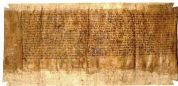
De akte van 4 maart 1424, het geboortekaartje van Hilversum