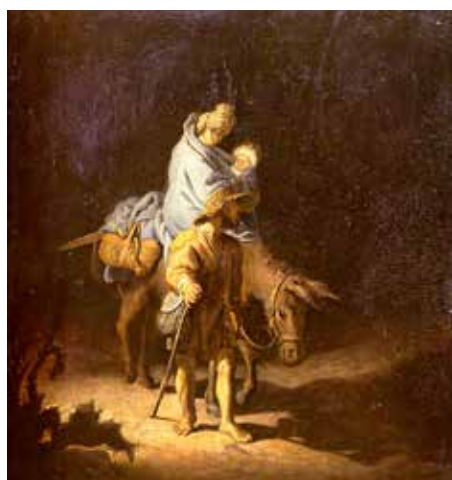
'Vlucht naar Egypte'

Aanmelden en kaartje kopen online via www.senver.nl of in het Senver-winkeltje in de bibliotheek op vrijdag tussen 10.30 en 12.00 uur.