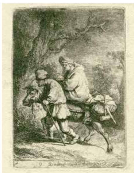
'Vlucht naar Egypte'

Hoewel het niet vaak uitgevoerd wordt, blijft dit koorwerk toch geliefd in de veelheid van klassieke meesterwerken.