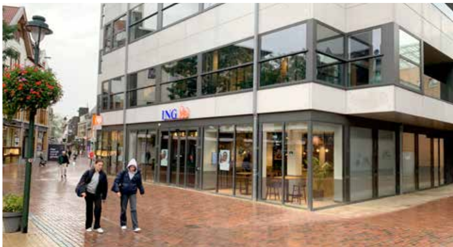
Het kantoor van ING in de Kerkstraat

N.B.: deze workshop is alleen voor mensen die een rekening bij de ING hebben.