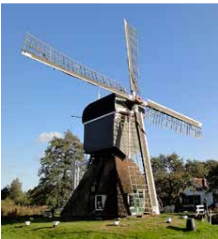
Molen De Trouwe Waghter op de Dwarsdijk

Op 2 november gaan we voor een pittige wandeling weer de vrije natuur in. We wandelen via het prachtige gebied van het Bert Bospad naar het (gesloten) Streekmuseum Vredegoed in Tienhoven, waar we gelegenheid hebben voor een kopje koffie en toiletbezoek (de consumpties moeten contant worden afgerekend). Vandaar banen wij ons via het Zoddenpad een weg via drassige paadjes van dit veengebied en schilderachtige opstapjes naar de molen aan de Dwarsdijk en over het wandel- en fietspad van de Kanaaldijk terug naar ons startpunt bij de hoek Egelshoek/Kanaaldijk.