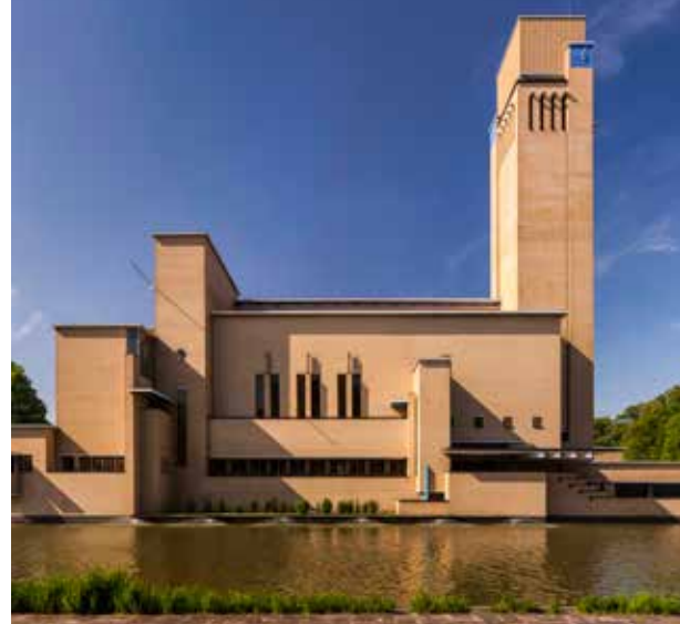
Hilversums bekende Raadhuis