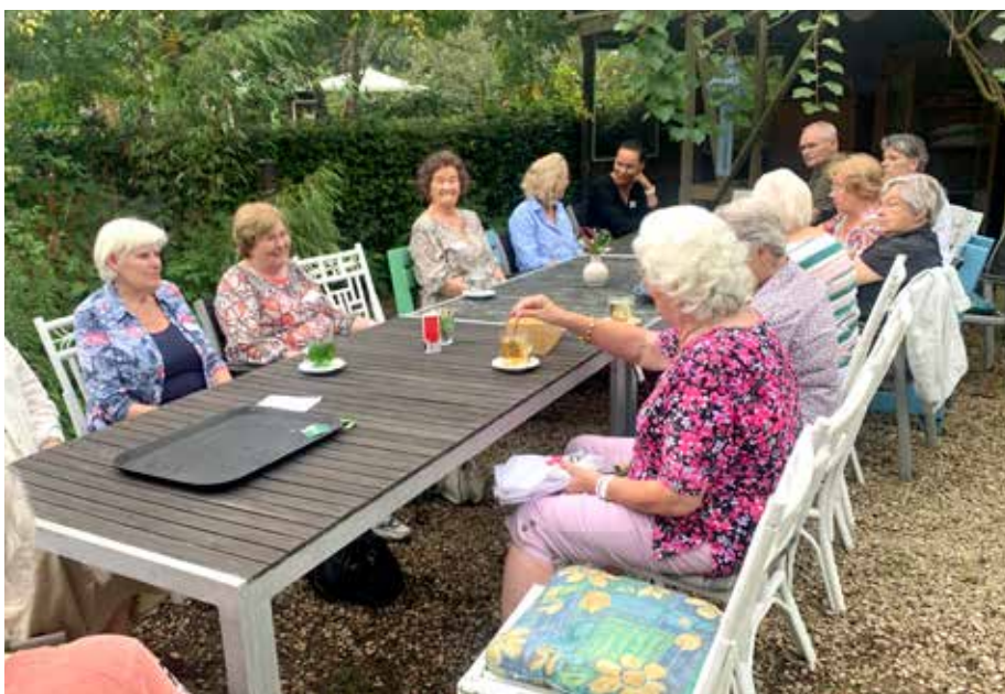
Deelnemers en begeleiders van de telefooncirkel ontmoeten elkaar een paar keer per jaar

Aanmelden bij Saskia Donk via e-mail aan saskia.donk@kpnmail.nl of als e-mailen niet lukt telefonisch, tel. 06 - 42244520. Kosteloos annuleren kan tot vrijdag 13 oktober, daarna worden de kosten net als bij no show doorberekend.