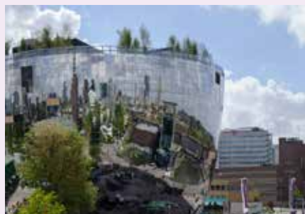
'Het Depot' is het thema van de lezing in november