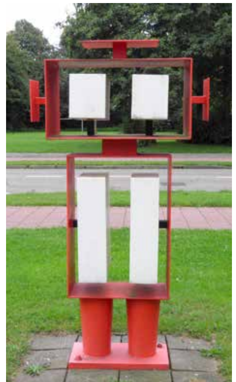
'Rode Robot' van Rob Stultiens uit 1970

Aanmelden en kaartje kopen online via www.senver.nl , of in het Senver-winkeltje in de bibliotheek op vrijdagmorgen van 10.30 tot 12.00 uur.