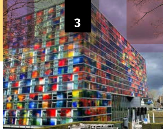
Beeld & Geluid, een van de culturele instellingen