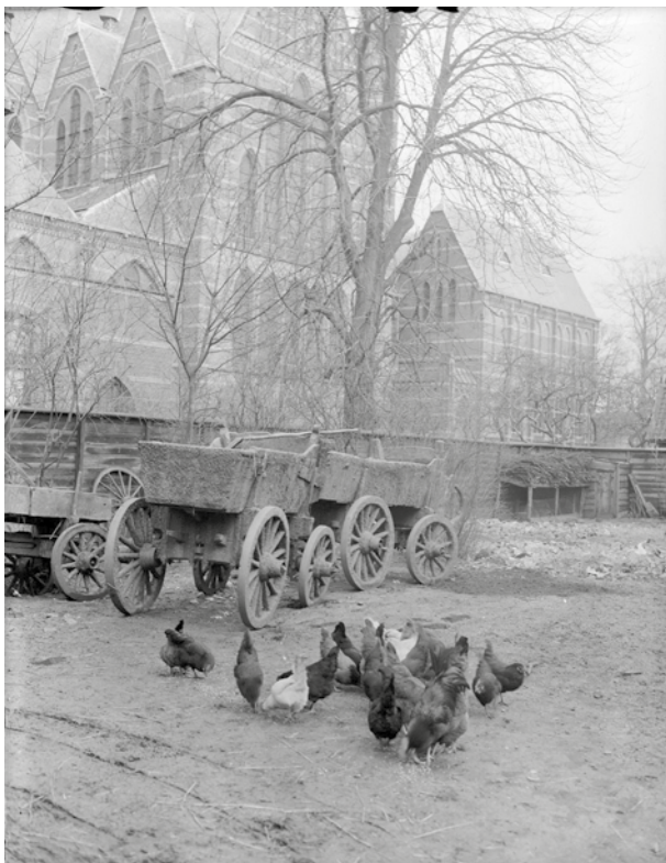
Een erf met boerenkarren en scharrelende kippen, in het centrum van Hilversum! En nog niet eens zó lang geleden: links is een foto uit 1952.

Op de achtergrond is de St. Vituskerk te zien, met rechts het sacristiegebouw. Het terrein op de voorgrond was het erf van de boerderij die stond aan de Emmastraat. Het gebouw bestaat nog steeds: het is nu het Chinees specialiteitenrestaurant Royal Mandarin, Emmastraat 9. En dat erf, daar staan nu andere karren: het is het parkeerterrein achter het restaurant. De fotograaf die indertijd deze opname maakte, Jacq Stevens, stond met zijn rug naar het verbindingsstraatje tussen Emmastraat en Achterom. Nu heet dat de Sint Vitusstraat, maar toen was het de Liebergerstraat.