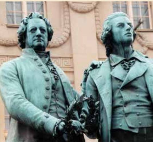
Twee groten uit de Duitse literatuur: Goethe (l) en Schiller

Datum dinsdag 19 september, van 14.30 tot 16.30 uur