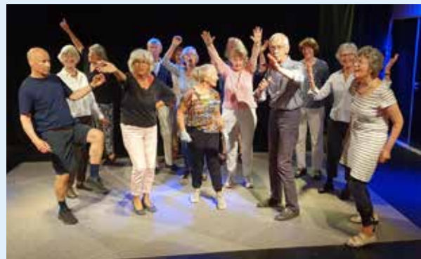
Deelnemers aan de theaterlessen

Het was weer een hele drukke maand, vol met bijzondere evenementen. Midden in de nacht op een bootje sterren kijken, voor de eerste keer de tango dansen, fietsen door de regen om de geschiedenis van Hilversum te ontdekken, of zoals op de foto: gekke theateroefeningen doen.