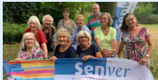
Vrijwilligers Zomerschool 2022

Er komen workshops schilderen, keramiek, verschillende soorten dans en theaterlessen. Het programma wordt gepubliceerd in een apart katern bij het maandblad van juli, dat verschijnt op 23 juni.