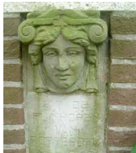
Rotterdams meisjes kopje, uit de puinhopen van het bombardement van Rotterdam gered, en na omzwervingen in Hilversum terecht gekomen.

Kosten geen kosten, een vrijwillige bijdrage voor het onderhoud van De Hof wordt erg op prijs gesteld. Na afloop in de giftenbox, contant of via een QR-code.