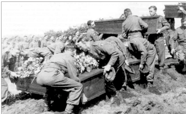
De omgekomen Britse soldaten worden door kameraden ten grave gelegd in Hilversum.

Hilversum werd bevrijd op 7 mei 1945. Maar daarmee was de oorlog helaas nog niet voorbij. Drie dagen later vielen er door een tragisch ongeval nog achttien doden onder de Engelse en Duitse militairen.