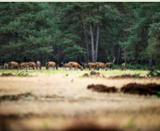
Bosrand Planken Wambuis

Sinds vorig jaar heeft Senver een wildspeurclub. Een groep enthousiaste Senver-leden gaat regelmatig op stap om wild te ontdekken. Ook het voorjaar 2023 is het weer tijd om op stap te gaan en er is dus voor het komende seizoen een mooi programma opgesteld.