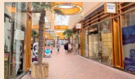
De Gooise Brink waar rechts de bibliotheek gepland is.

De verhuizing van de bibliotheek naar de Gooise Brink staat gepland voor eind 2024. Senver maakt voor de culturele lezingen gebruik van ruimte in de bibliotheek. En de leden komen er natuurlijk ook om boeken te ruilen en voor andere evenementen. De verhuizing naar de Gooise Brink roept veel vragen op. Hoe zit het met de bereikbaarheid, kun je er nog met de auto in de buurt komen, kun je je door de WMO-taxi of de Stadsauto voor de deur laten afzetten? Komt er een fietsenstalling?