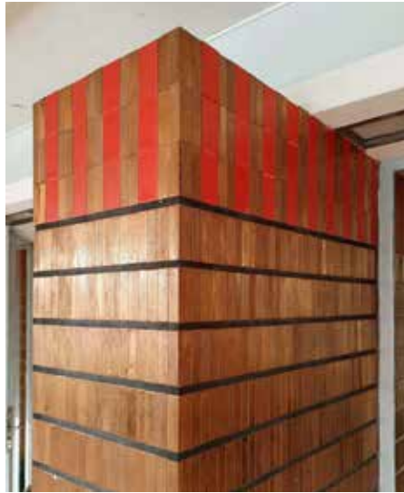
Tegels aan pilaren van het raadhuis, die terugkeren in de optiekwinkel.