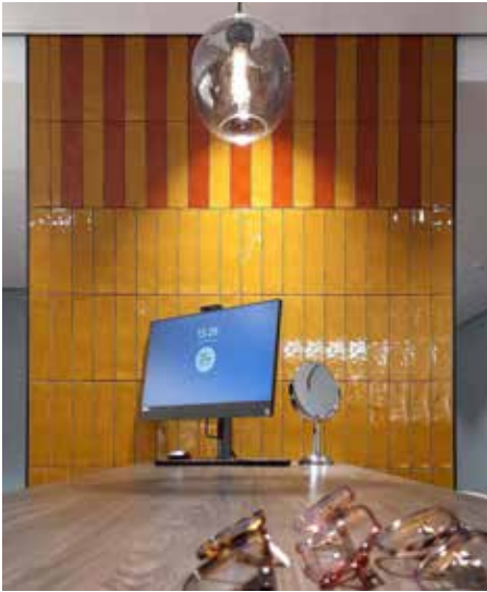
Een stukje muur in de nieuwe winkel: een duidelijke verwijzing naar het Hilversums raadhuis.