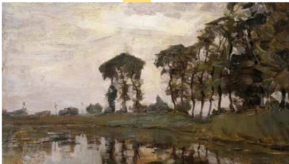
'Bocht aan het Gein' - 1907

Aanmelden tot 4 januari bij Ans Slagboom, slaggies@kpnmail.nl of via tel. 035-6856626. Graag vermelden of je vegetarisch wilt eten of allergieën hebt. Mocht je toch verhinderd zijn, meld je dan meteen af bij Ans, uiterlijk tot 7 januari, zodat er nog iemand in jouw plaats kan komen.