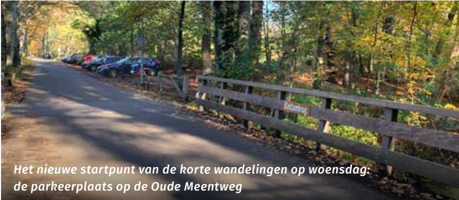
Het nieuwe startpunt van de korte wandelingen op woensdag: de parkeerplaats op de Oude Meentweg

Heb je zin in een wandeling? Elke woensdagmiddag vertrekt er een Senverwandeling vanaf de parkeerplaats bij het Spanderswoud net voorbij de beeldentuin De Zanderij. De weg heet de Oude Meentweg en is toegankelijk vanaf de 's-Gravelandseweg. Vertrek om 14.00 uur.