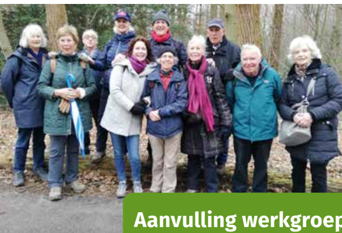
De 'lange-wandelaars' op de kiek bij een eerdere wandeling.

De organisatoren van de lange wandelingen hebben besloten om een winterstop te houden. De wandelingen op de eerste donderdag van december, januari en februari vervallen daarmee. De eerstkomende lange wandeling is op donderdag 2 maart 2023.