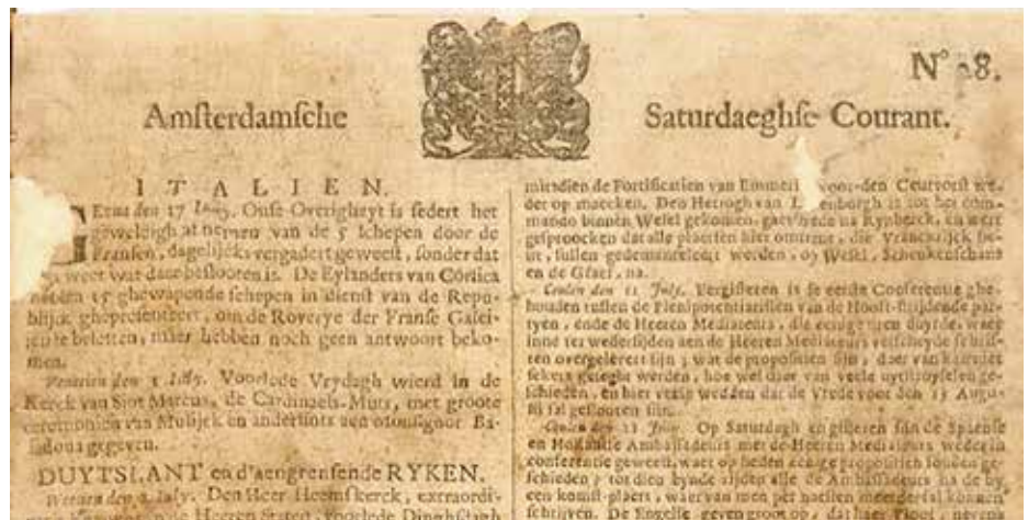
De kop van de Amsterdamsche Saturdaeghse Courant van 15 juli 1673

Dus: maar eens even kijken wat het zoekwoord ‘Hilversum’ oplevert. De bescheiden rol van Hilversum is eraan af te lezen, slechts vijf keer komt die