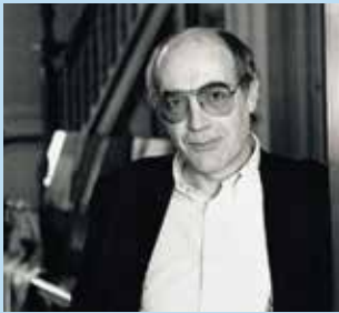
4 Poëziemiddag over Herman de Coninck