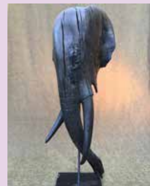
Dick Sierksma maakt beelden uit hout van duizenden jaar oud

Op 9 oktober is Ludek Tikovsky er om te meer te vertellen over zijn eigen vorm van grafiek die hij Tikography noemt.