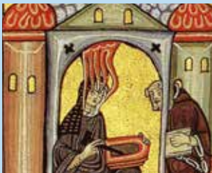
5 Muziekochtend: Hildegard van Bingen