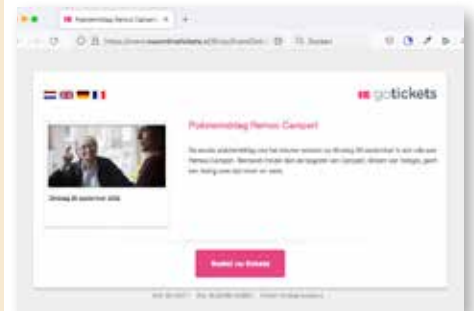
De nieuwe bestelpagina

Het wordt een heel bijzondere middag over een heel bijzondere Nederlandse dichter.