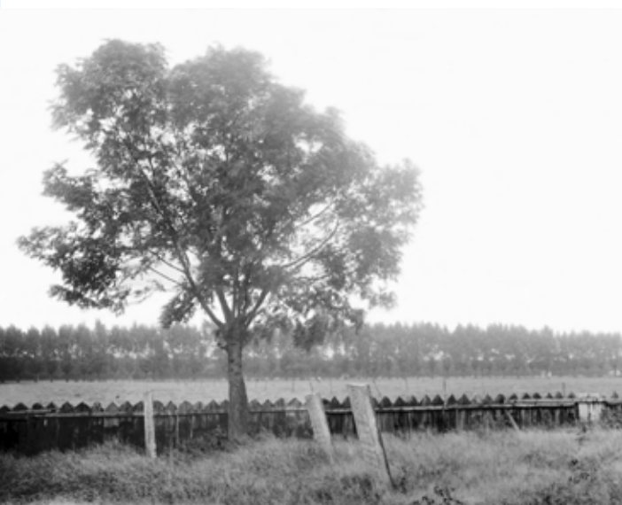
Drie stenen op de oudste joodse begraafplaats in Hilversum (foto 1931, glasnegatief Gemeente Hilversum)

Turend op een oude landkaart kom je soms dingen tegen die je niet wist. Een voorbeeld. Op een kaart van Hilversum uit 1905 staat de joodse begraafplaats getekend, die er nog steeds is: ingeklemd tussen Zeverijnstraat en Vreelandseweg. Maar tot mijn verbazing staat er nóg een joodse begraafplaats op: de 'oude Israelitische begraafplaats' aan wat nu de Nieuwe Havenweg heet. Hoe zit dát?