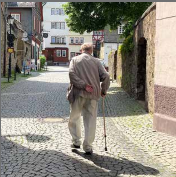
Thema: Oude mensen