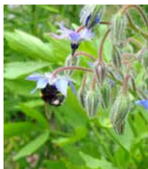
Bloeiend komkommerkruid in de Riebeecktuin