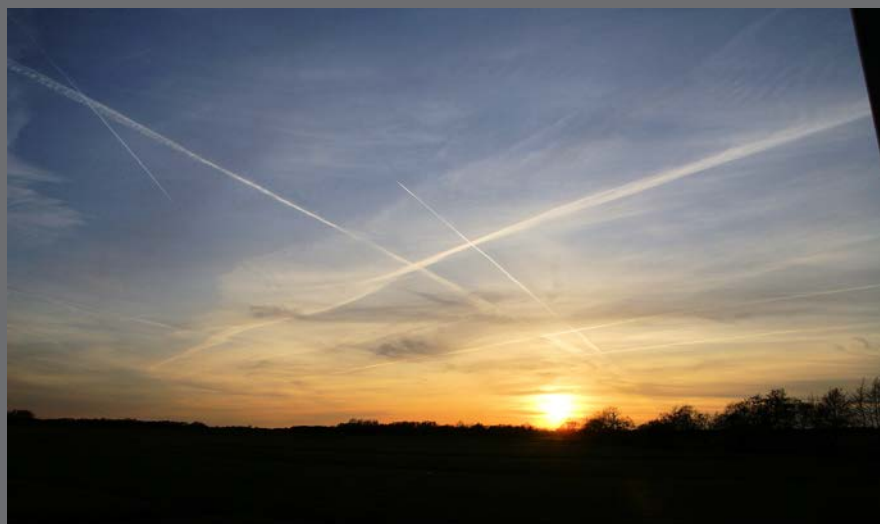
Thema: Zonsondergang