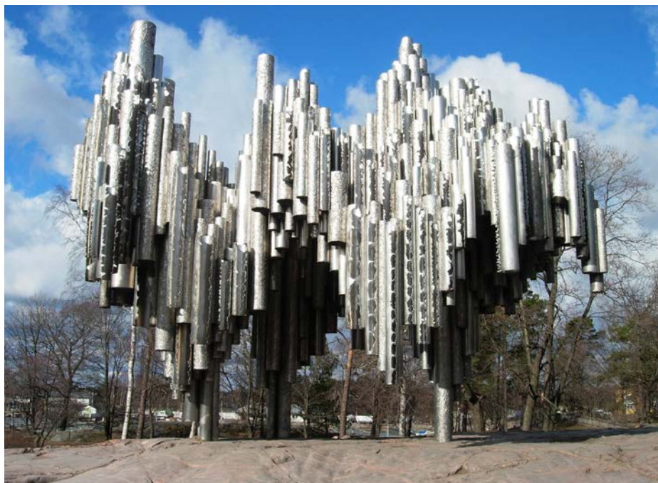
Het Sibeliusmonument in de Finse hoofdstad Helsinki. Het beeld bevindt zich in het Sibeliuspark en is ontworpen door de Finse beeldhouwer Eila Hiltunen. Het beeld bestaat uit 600 aan elkaar gelaste pijpen in een golvende beweging.