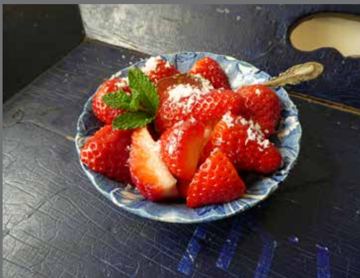
Thema: Rood/Wit/Blauw