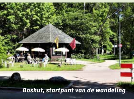
Boshut, startpunt van de wandeling

Onder de naaldbomen die van nature in Nederland en België voorkomen neemt de Grove den, Pinus sylvestris , een belangrijke plaats in, vooral omdat de soort veel is aangeplant voor zogenaamd mijnhout. Ook werden ze gebruikt voor scheepsmasten. Vroeger werden deze bomen mastbomen of pijnbomen genoemd. Grove den herken je o.a. aan de twee naalden die bij elkaar uit een twijg komen. Ze zijn rond 5 cm lang. Vrijstaande Grove dennen passen zich onder invloed van de overheersende windrichting aan en krijgen een typische vorm die wij van oudsher vliegdenen noemen. Ze ontstaan door natuurlijke uitzaaiing. De Grove den is een pionierssoort die goed groeit op voedselarme gronden zoals droge zandgronden. De boom kan wel 600 jaar worden en heeft een penwortel waarmee ook uit grotere diepte water opgenomen kan worden.