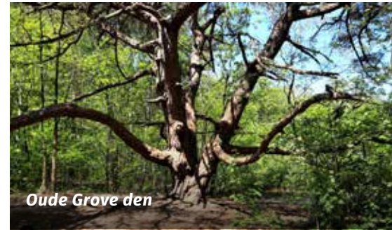
Oude Grove den

Tjepkje Gersjes, Senver-lid en IVN-gids, heeft weer een mooie, verrassende wandeling beschreven. Dat deed ze steeds tijdens coronatijd. Vanaf volgende maand gaat ze zelf weer wandelingen begeleiden. De wandeling die ze voor deze maand beschrijft, voert door een afwisselend bosgebied, langs spannende waterpartijen en bijzondere boomvormen. De start is naast de parkeerplaats bij de Boshut, eind Bussumergrintweg-Bachlaan. Op een enkele plek is de route minder geschikt voor wandelwagens. In een deel van het terrein dienen honden te zijn aangelijnd tijdens het broedseizoen (15 maart-15 juli). De afstand van de wandeling is 4 à 4,5 km en volgt de gele pijlen.