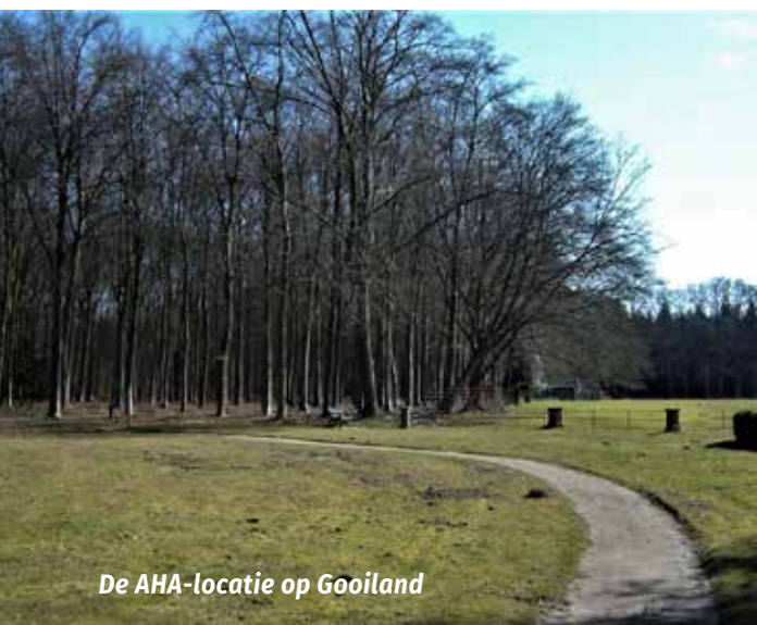
De AHA-locatie op Gooiland

Buitenplaats Gooilust wordt gekenmerkt door, hulst langs de lanen, klimopbegroeiing langs de stammen, bamboebosjes her en der en rododendrons op heel veel plaatsen.