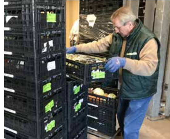
Chauffeurs leveren nieuwe voorraden

Wanneer maandag 12 oktober om 14.00 uur Waar Korte Noorderweg 36 Aanmelden vooraf is noodzakelijk, want er kan maar een klein clubje mee. Mail naar inschrijving@senver.nl of bel naar Ike Heerschop 035 – 6857016.