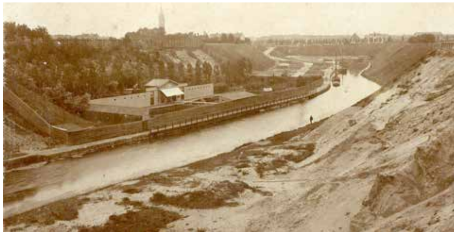
De Oude Haven in 1895, met links-midden het openluchtzwembad en aan het eind de Havenstraat

Op donderdag 15 oktober is er voor Senver-leden een stadswandeling door en rond de Oude Haven: een kennismaking met een stuk historie van 380 jaar. Het is een verhaal over zand, véél zand, over aquariumvissen en ijsvogels, over groen, over vier werken van Dudok, over vandalisme en opknappen, en over een openluchtzwembad. We leren ondertussen twee nieuwe woorden en we komen zelfs de schrijver Louis Couperus tegen.