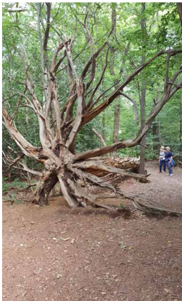
Wandelend kom je vaak de mooiste natuurlijke kunst tegen. Foto gemaakt in 's-Graveland, door Carla Hillesum-Blitz

Vaste activiteiten die weer van start zijn gegaan