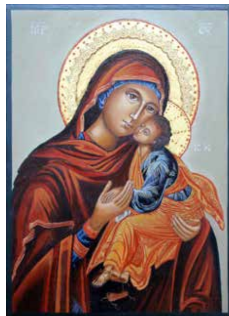
Maria met kind

Ikonen worden gemaakt op dezelfde manier als zo'n vijftienhonderd jaar geleden, in precies dezelfde volgorde. 'Je begint met een houten paneel. Dat maak ik zelf. Met beenderlijm of huidlijm plak ik daar linnen op. En dan volgen lagen van een mengsel van lijm met kalk en water. Pas na tien lagen op dat paneel kan er geschilderd worden.' Dat schilderen gebeurt met natuurlijke kleurstoffen zoals gemalen mica, gedroogd en gemalen bladluis, oker, goud, en met ei-geel als hechtmiddel. Je bent niet vrij om maar te schilderen waar je zin in hebt: alleen in het schilderen van de achtergrond ben je vrij, maar niet in de keuze van onderwerpen, niet in de houding van de figuren, niet in de kleuren van de kleding. Je volgt