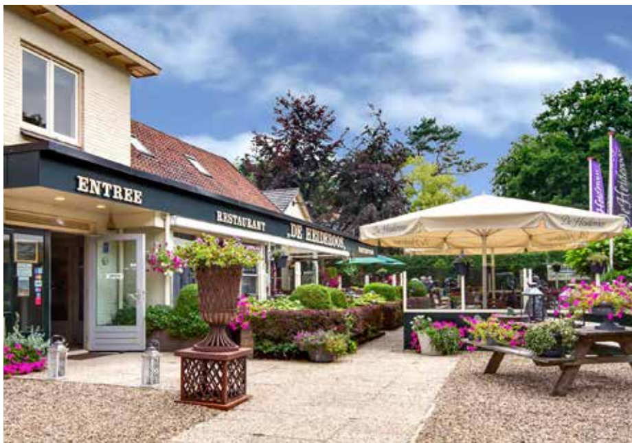
Restaurant De Heideroos

Voor wie niet meer zo goed ter been is of ook als je het gewoon gezellig vindt om er toch even lekker uit te zijn, hebben we onze bus-dagtochten. Je hoeft haast niet te lopen, maar laat je lekker rondrijden of -varen om te genieten van de natuur en de omgeving buiten.