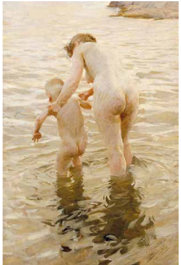
De eerste keer, 1888, Art Museum Helsinki

Maar het zijn de werken van vrouwelijk naakt die hem tot publieksliefeling maken. Zorn brengt een nieuwe sensualiteit naar dit genre door zijn modellen niet alleen in het atelier, maar ook in de Zweedse natuur te schilderen. Al pootjebadend in kabbelend water of struinend door groene velden ogen de vrouwen ontspannen en vrij. Het naakt is bij hem niet langer alleen maar een romantische of klassiek geïdealiseerde godin, maar een gewone vrouw van vlees en bloed.