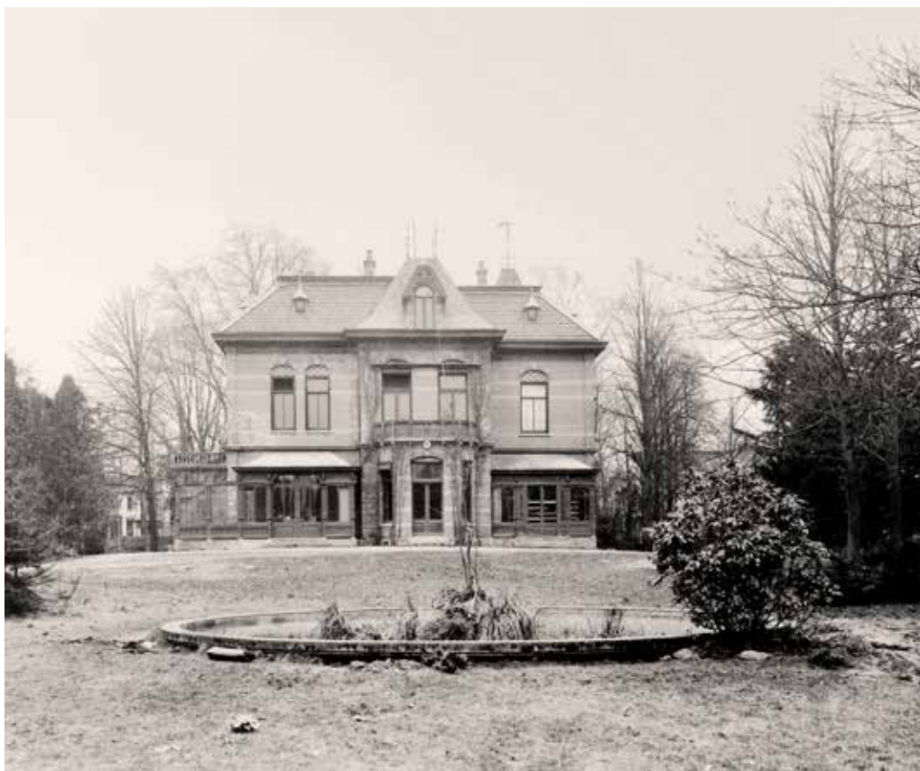
Villa 'Witten Hull'