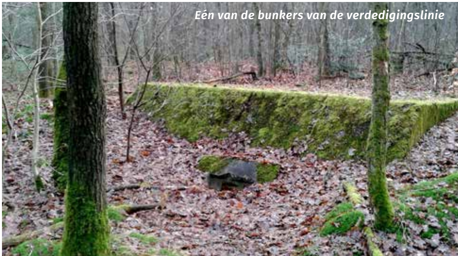
Eén van de bunkers van de verdedigingslinie

In november zouden we een wandeling gemaakt hebben met IVN-gidsen door de Fransche Kamp. Die wandeling gaat niet door, maar u kunt wel zelf een rondje maken. U start op de Camping De Fransche Kamp, Franse Kampweg 5a in Bussum. De routebeschrijving van deze wandeling staat aansluitend op dit artikel en is te vinden op de website www.senver.nl