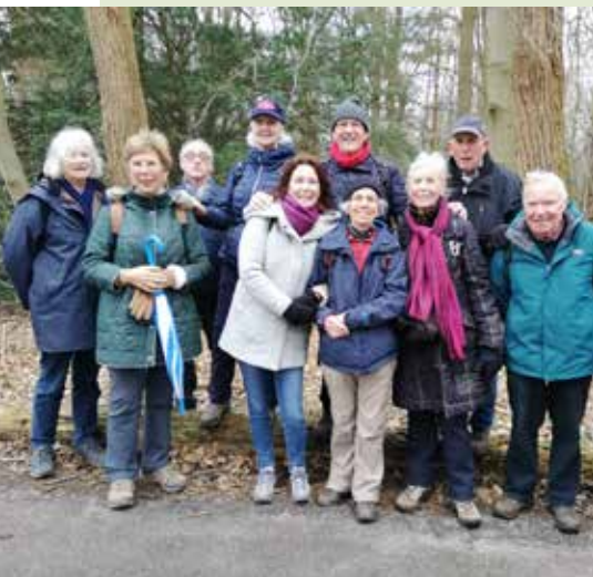
Een lange wandeling in betere en koelere tijden.

Wil je toch eens met iemand anders 10 tot 15 km stevig wandelen, stuur dan een mail naar ank.vuijst@hetnet.nl