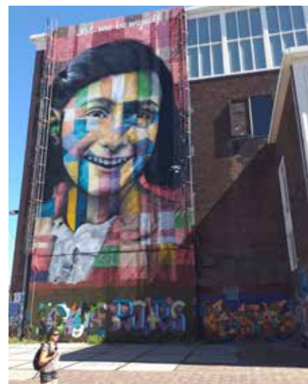
Amsterdam: wandeling door het Westelijk Havengebied Amsterdam