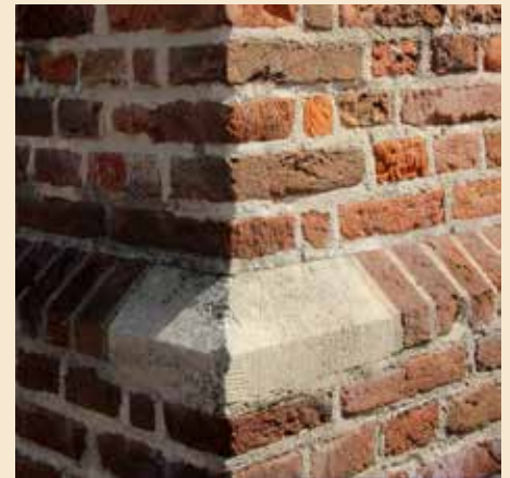
Leg uw handen eens op de stenen van de kerktoren: stenen uit 1481!

In 1971 volgde een enorme brand, velen van ons herinneren zich die tragische avond nog wel. Van de kerk bleef een ruïne over en ook de toren was zwaar beschadigd. De toren werd in 1974 herbouwd, de kerk in 1976: weer in neo-renaïssancestijl, maar met een heel modern interieur. Dat betekent dus, dat het huidige kerkgebouw vierhonderd jaar jonger is