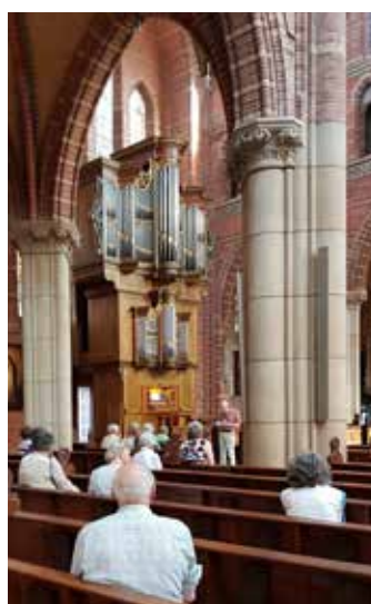
Uitleg over het prachtige orgel in de Vituskerk