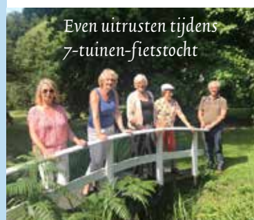
Even uitrusten tijdens 7-tuinen-fietstocht