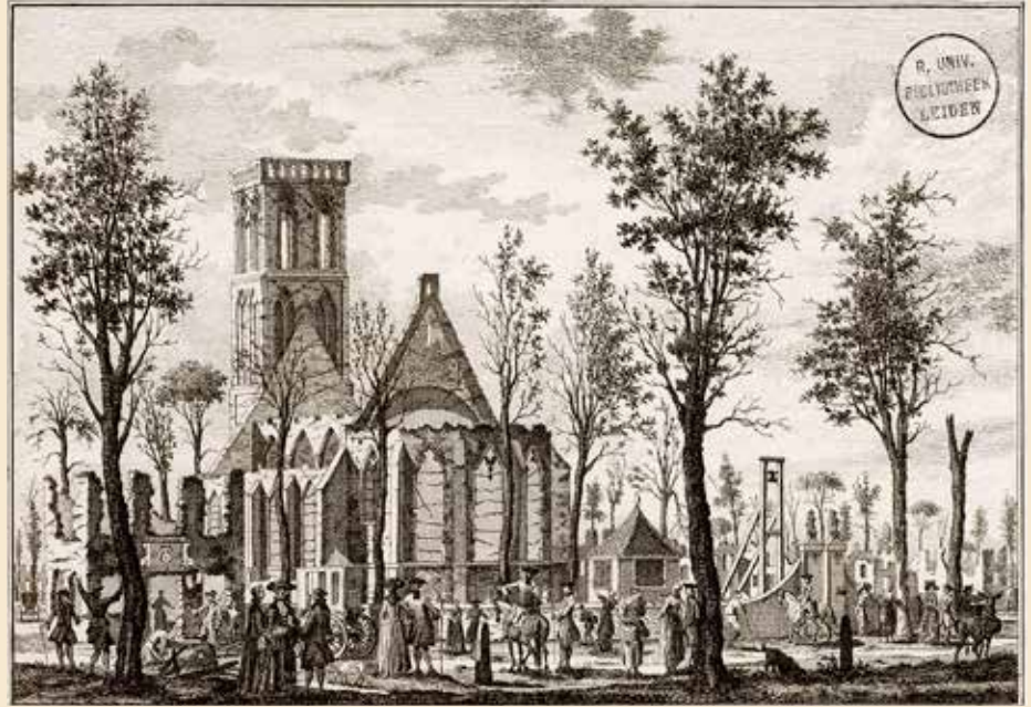
Een ets van Willem Writs: de Grote Kerk na de brand in 1766.

Dat is dus 539 jaar geleden. Daarvòòr stond op die plek waarschijnlijk al een kapel, sinds 1250, maar voor een echte kerkdienst moest je toen nog naar Laren. In 1416 werd de kapel een dorpskerk, met dank aan de bisschop van Utrecht. En in 1481 werd een nieuwe kerk met toren gebouwd. De toren heeft die 539 jaren niet zonder kleerscheuren doorstaan en met het kerkgebouw zelf ging het nog veel slechter. In 1629 werd Hilversum, inclusief de kerk, grotendeels platgebrand door Oostenrijkse troepen. In 1725 was er een forse brand die 60 huizen in de as legde. In 1766 was het nog erger: een brand die ontstond