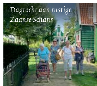
Dagtocht aan rustige Zaanse Schans