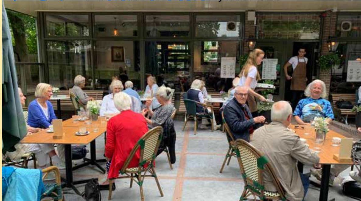
Een hoera bij de start van het Seniorencafé

Voor die eerste maandag moest je je aanmelden, maar dat doen we niet meer. Ben je op tijd, dan kun je erbij, en anders heb je pech. Bij mooi weer zijn er veel meer mensen welkom vanwege het terras. Aanvangstijd gedurende de coronacrisis is 10.00 uur en afsluiting om 11.30 uur. Betaling bij voorkeur met pin.