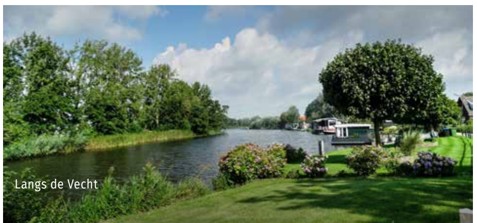
Langs de Vecht