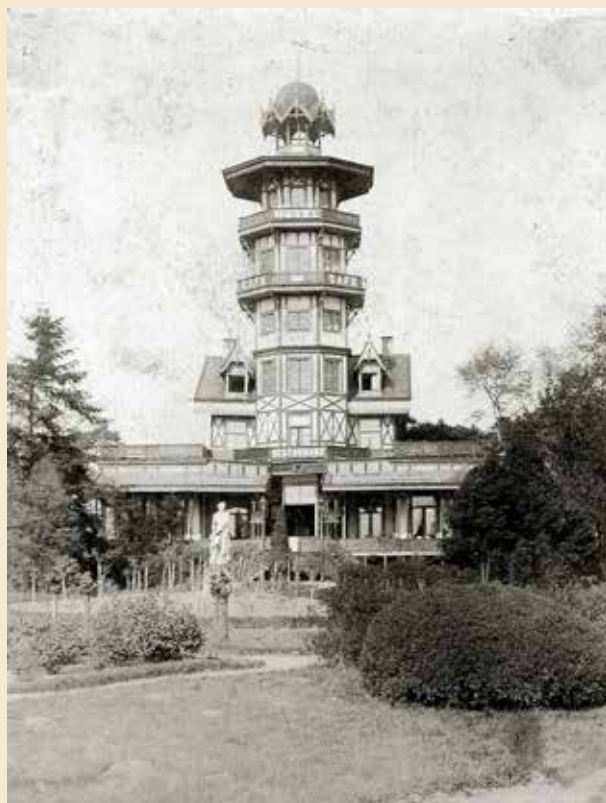
De belvédère bij Laren, van 1881 tot 1931.

(Bron Historische Kring Laren en 'Tussen Vecht en Eem')