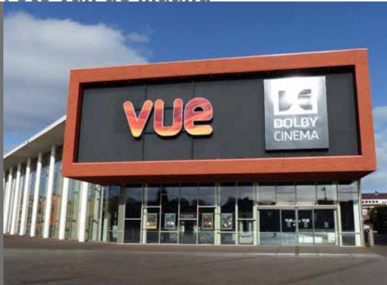
Thema: Gevels