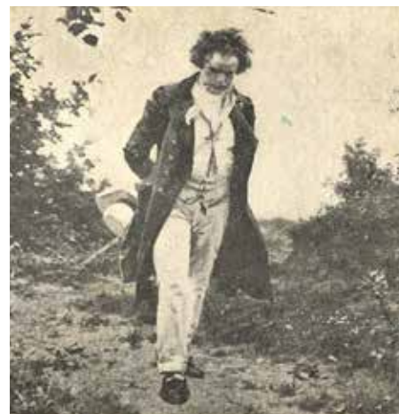
Beethoven wandelde veel.