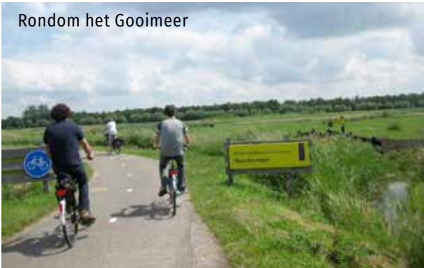
Rondom het Gooimeer

De fiets-werkgroep, die in normale tijden van die leuke tochten organiseert, geeft de volgende tips voor leuke routes: