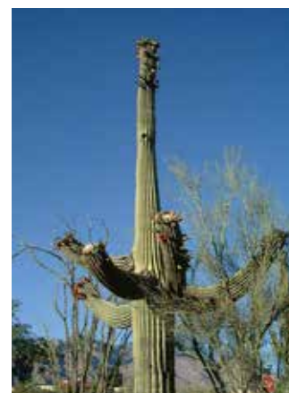
Reuzecactus die daar veel voorkomt