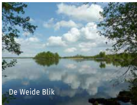
De Weide Blik