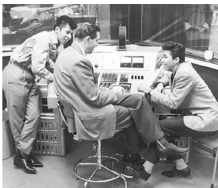
The Blue Diamonds in de Phonogram-studio

De historielezing op 17 februari gaat over het Hilversums muziekleven in de afgelopen decennia: niet de klassieke muziek, maar het lichtere genre.