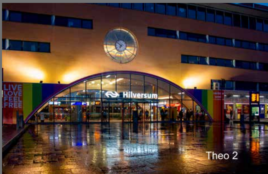
Thema: Architectuur in eigen woonplaats