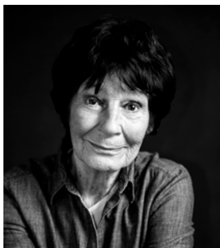
Mies Bouwman