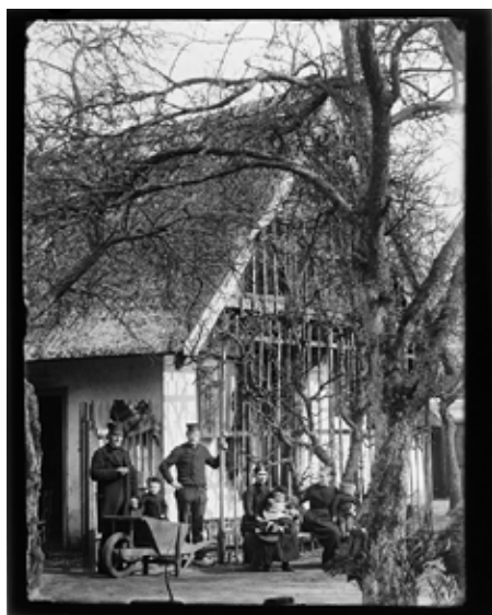
Een foto van Jacob Olie uit 1893 van een boerderij aan de 's-Gravelandseweg.

De kartjes voor de lezingen van vrijdag 3 en dinsdag 7 januari (over pianomuziek in allerlei vormen) zijn te bestellen vanaf half december.