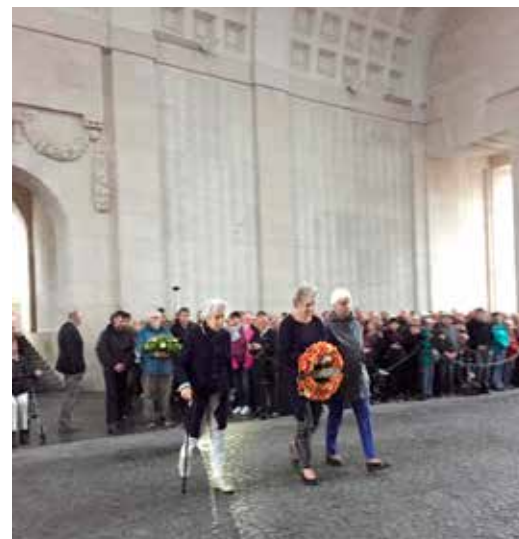
Deelnemers aan de vakantiereis legden een krans onder de Menempoor in Ieper.