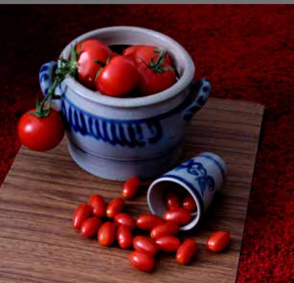
Thema 'groente en fruit' Ans Roodenburg