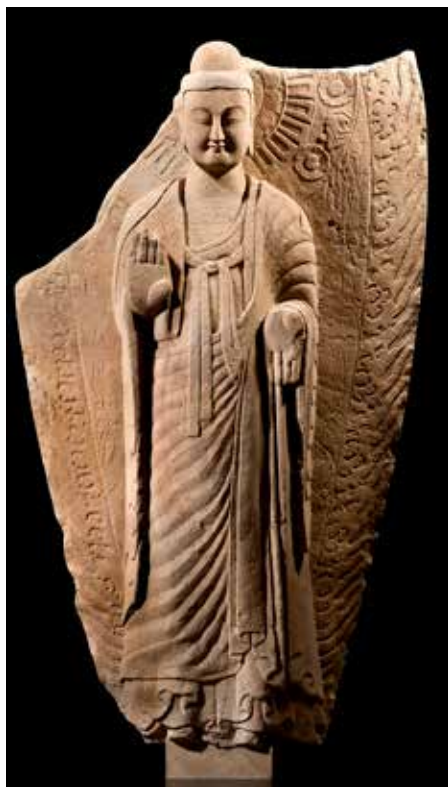
Chinese Boeddha, ca. 600