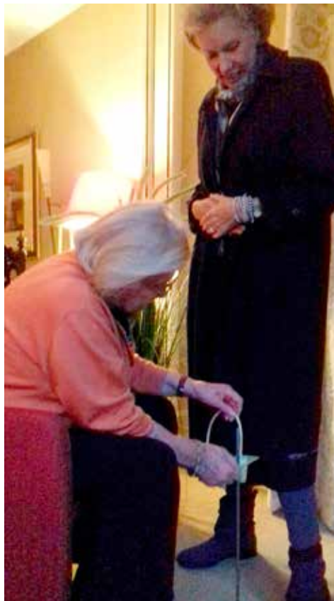
Gebruik pufspuit om de lengte te bepalen.