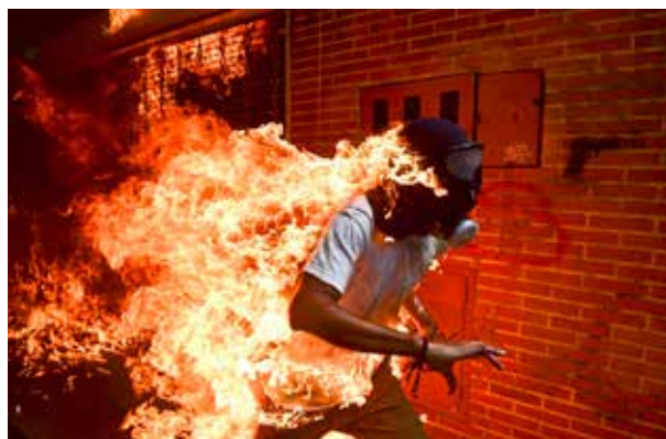
De Venezolaanse fotograaf Ronaldo Schemidt won de World Press Photo met zijn foto van een brandende demonstrant in Venezuela.

Aanmelden bij Veronique Jansen, liefst per e-mail: communicatie@museumhilversum.nl of anders via telefoon 035-5339601.