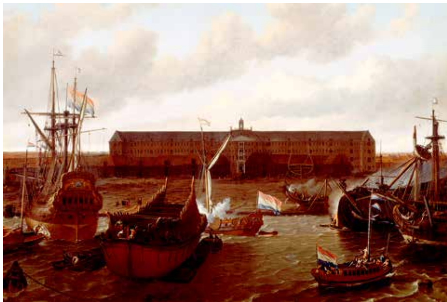
VOC-magazijn en -werf in Amsterdam, geschilderd door Ludolf Bakhuizen, 1696