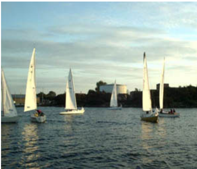
Startfelt onsdagssejlads. 2012?