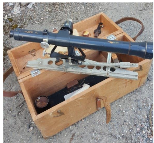
88 Teodolit med trälåda