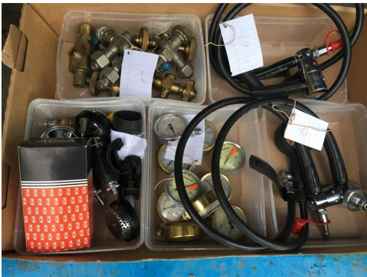
Lådor 67, 68, 69, 70 och 72