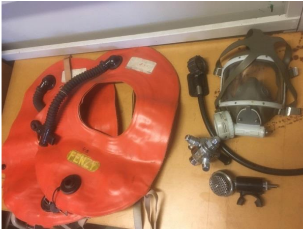
Föremål i låda 63