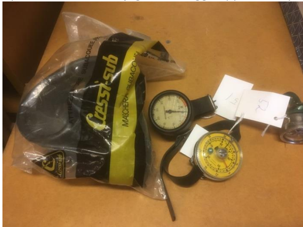
Föremål 50, 51, 52 och 53

Tyvärr har vi inte möjlighet att lägga upp en komplett bildkatalog, men här finns exempel på föremål.