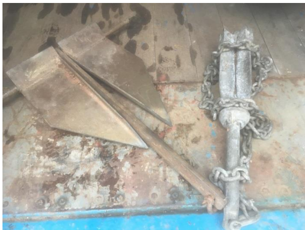
Föremål 65 och 66