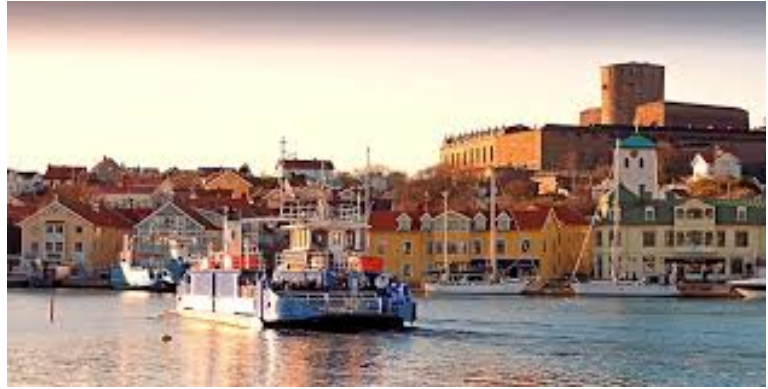
Färjan som tar oss över till Marstrandsön och fästningen.

Välkomna till en förhoppningsvis synnerligen givande helg vad gäller diskussioner om SDHF:s framtid, trevlig samvaro, god mat och dryck samt ett litet inslag av lokal kulturhistoria.