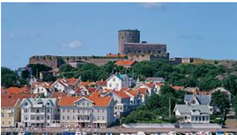
Utsikt från övervåningen.

Tag med egna sängkläder, handduk och ev snuttefilt.