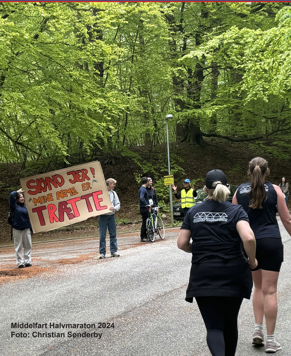
Middelfart Halvmaraton 2024