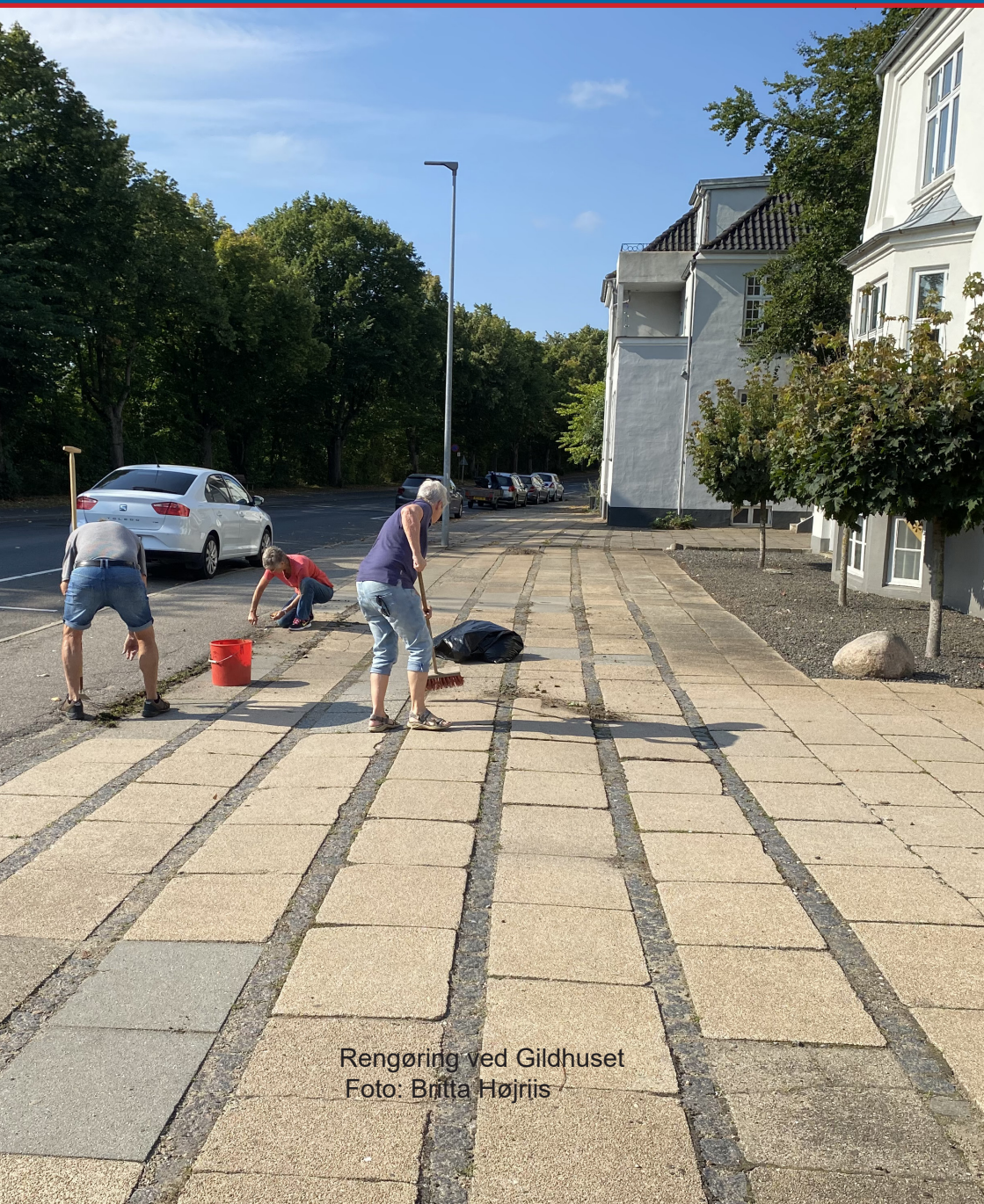
Rengøring ved Gildhuset