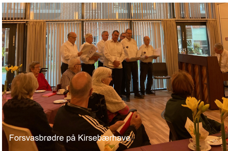
Forsvasbrødre på Kirsebærhave