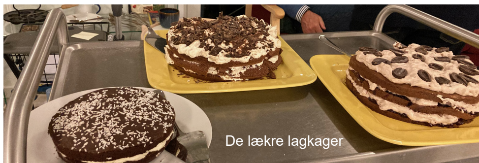
De lækre lagkager