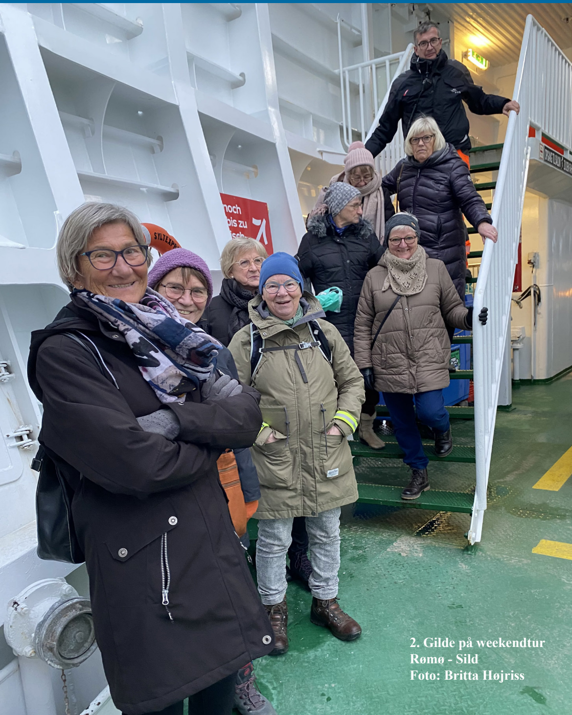
2. Gilde på weekendtur Rømø - Sild