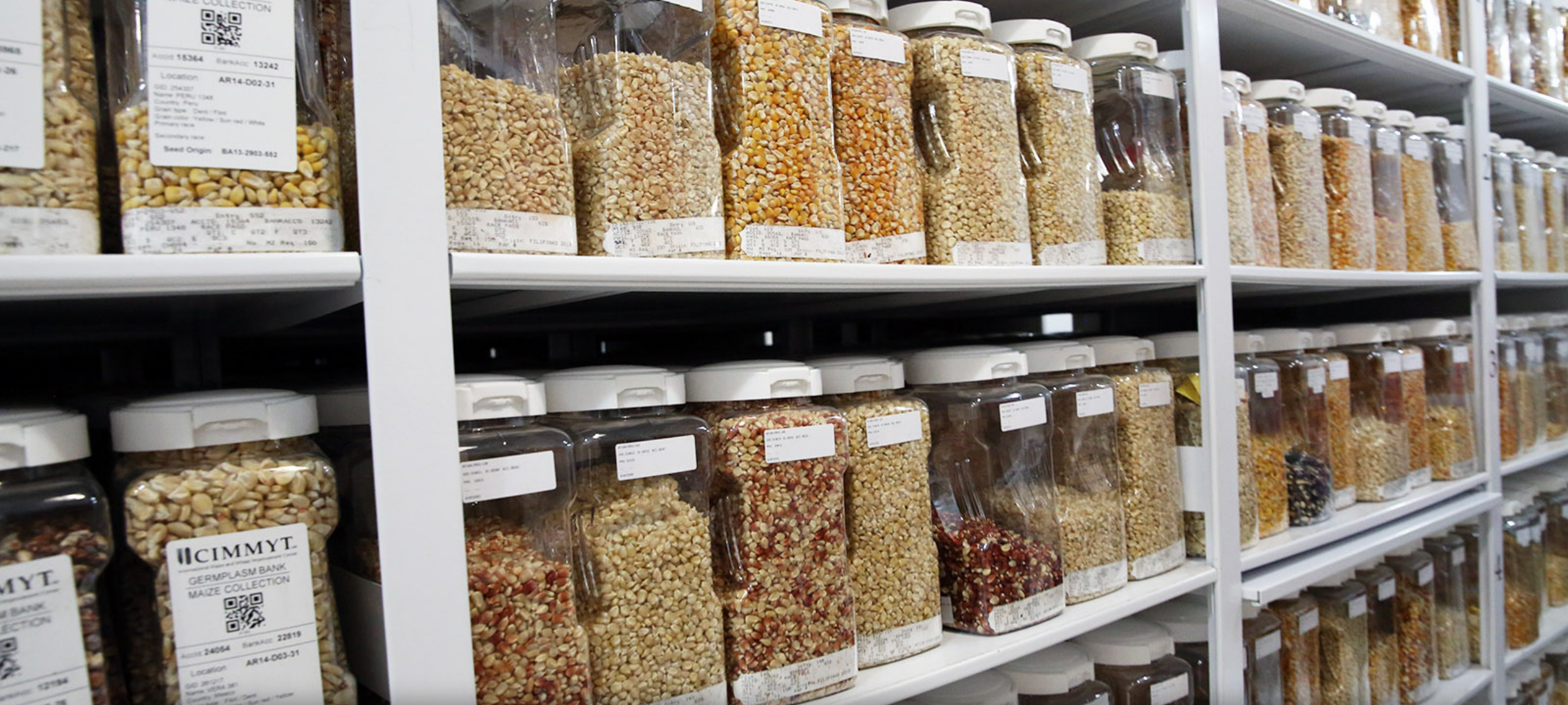
Seed bank and seeds production