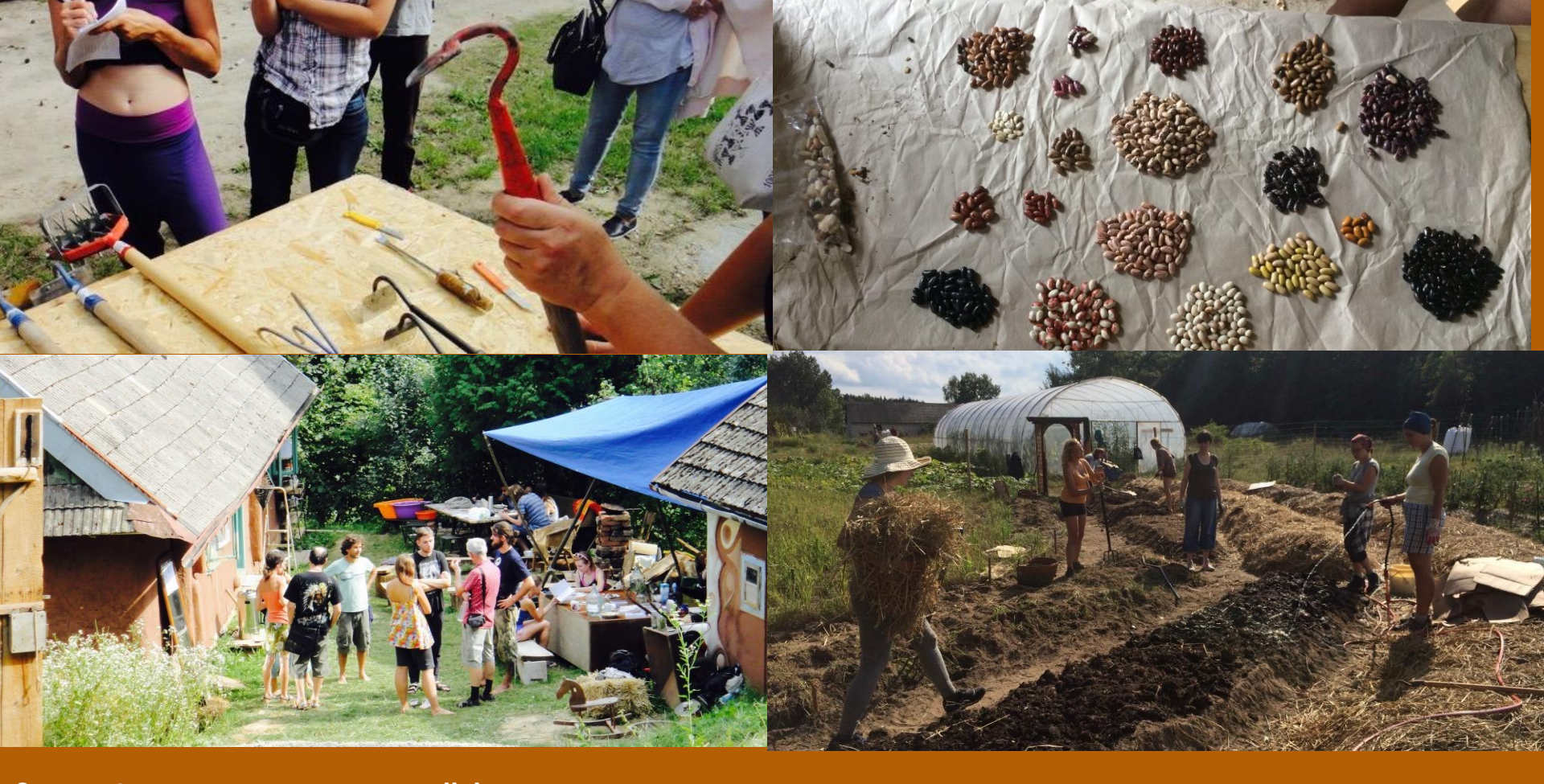
Scope of topics we cover in our collaborative trainings: organic farming, seeds, farm-autonomy, permaculture, soil health, low-input preservation...