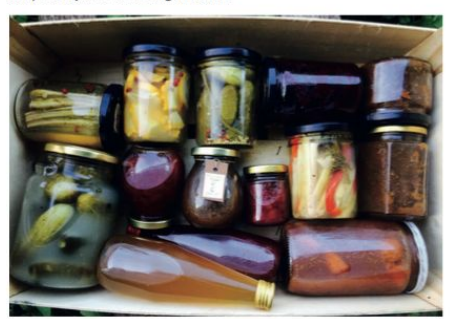
Przetwory na bazie własnych produktów pozwalają efektywnie zagospodarować nadwyżki produkcji, dodać produktom na wartości i wydłużyć ofertę sprzedażową.

Bez ograniczeń rolnik może więc sprzedawać konsumentowi warzywa i inne rośliny w stanie świeżym (surowym), suszone i kiszone. Sprzedaż produktów pochodzących od zwierząt regulowana jest innymi zasadami, ale w prostych formach, takich jak tuszki drobiowe, jaja, mleko, śmietana, ryby, itd., może odbywać się również na targowiskach.