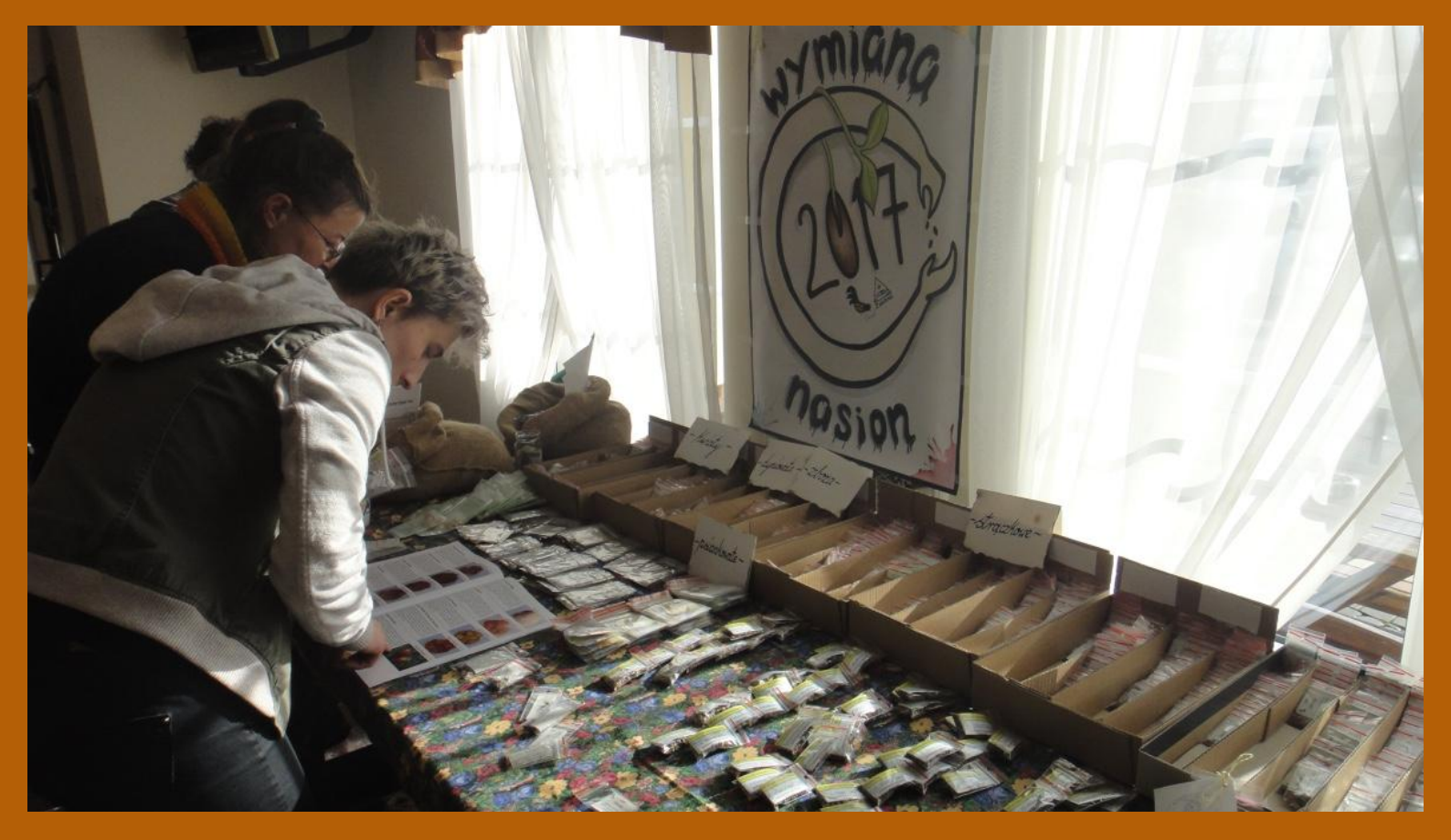
Seed exchanges at Good Harvest Seminars for organic farmers organized by Nyeleni Polska.