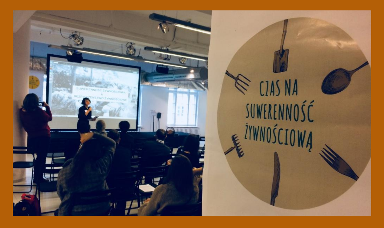
Presentations and lectures at events.