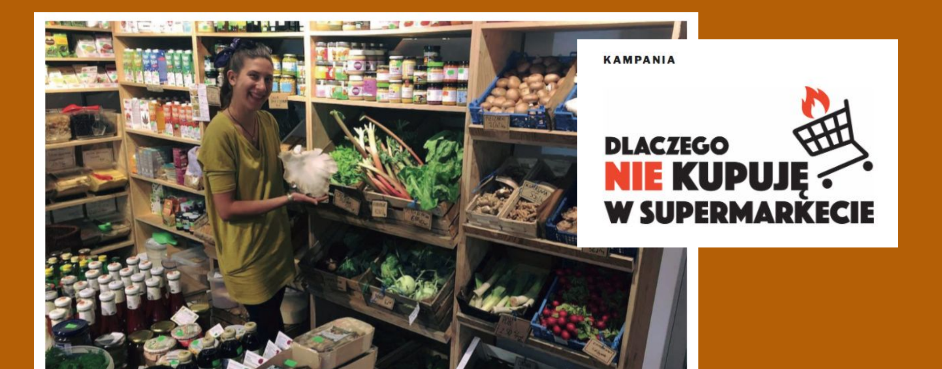
Sklep Kooperatywy "Dobrze" przy ulicy Andersa 27 w Warszawie.