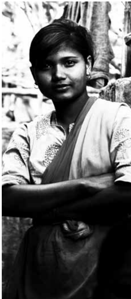
Barrio musulmán, Calcuta, India.

Los alimentos y el clima: cómo armar el rompecabezas. La mayoría de los estudios sitúan la contribución de las emisiones agrícolas —las emisiones producidas en los campos de cultivo— en algún punto entre el 11 y el 15% de las emisiones globales 1 . Sin embargo, lo que no es común que se diga es que la mayor parte de estas emisiones son generadas por las prácticas de cultivo industrial que se basan en fertilizantes químicos (con nitrógeno), maquinaria pesada que funciona con gasolina, y en operaciones industriales de crianza animal altamente concentradas que bombean a la atmósfera deshechos de metano.