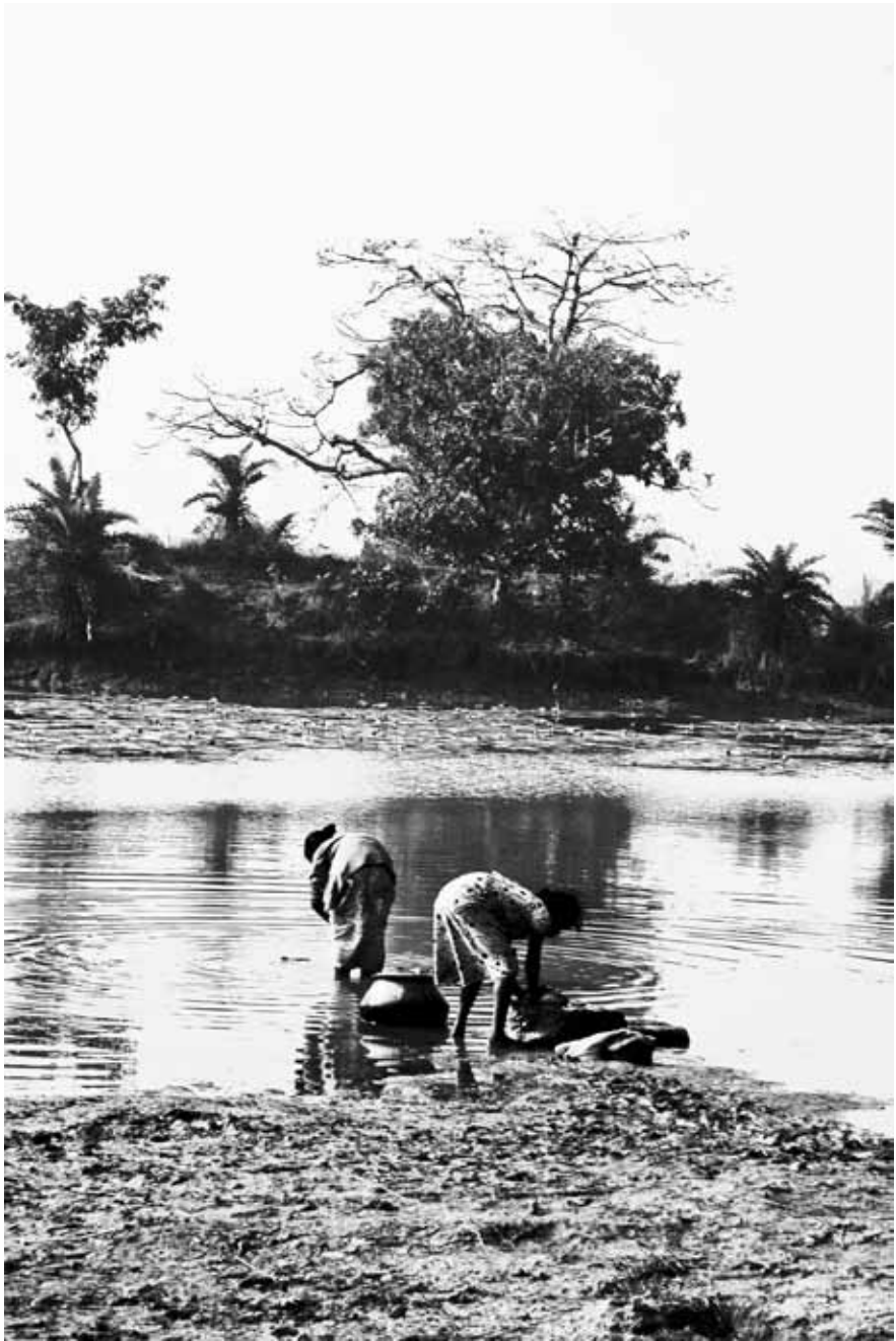
Lavanderas, Borotalpada, región bengalí, India.

El nuevo escenario requeriría un cambio radical de enfoque, apartándonos del actual modelo de agricultura industrial. Tendría que ponerse énfasis en el uso de técnicas tales como los sistemas de diversificación de cultivos, mejor integración entre la producción de cultivos y la producción animal, mayor incorporación de árboles y de vegetación silvestre, y más. Tal incremento en diversidad podría, entonces, incrementar la producción potencial, y la incorporación de materia orgánica mejoraría progresivamente la fertilidad de los suelos, creando círculos virtuosos de mayor productividad y mayor disponibilidad de materia orgánica. La capacidad del suelo para retener agua aumentaría, lo que significa que la lluvia excesiva conduciría a menores y menos intensas inundaciones y sequías. La erosión del suelo sería cada vez menos un problema. La acidez y la alcalinidad del suelo se reducirían, amainando o eliminando la toxicidad que se ha