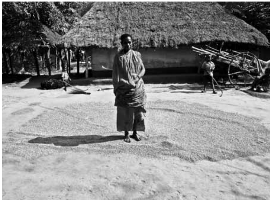
Patio de secado de arroz, Borotalpada, comunidad sandal, región bengalí, India.

No todo lo que produce el sistema alimentario se consume. El sistema agroalimentario industrial descarta cerca de la mitad de toda la comida que produce, en su viaje de los establecimientos agrícolas a los comerciantes, a los procesadores de comida, a las tiendas y supermercados. Esto es suficiente para alimentar a los hambrientos del mundo seis veces 10 . Gran parte de este desperdicio se pudre en los tiraderos de basura y en los rellenos sanitarios, produciendo cantidades importantes de gases con efecto de invernadero. Diferentes estudios indican que entre unos 3.5 y 4.5% de las emisiones globales de GEI provienen de los desechos, y más de 90 % de ellos proceden de materia originada en la agricultura y