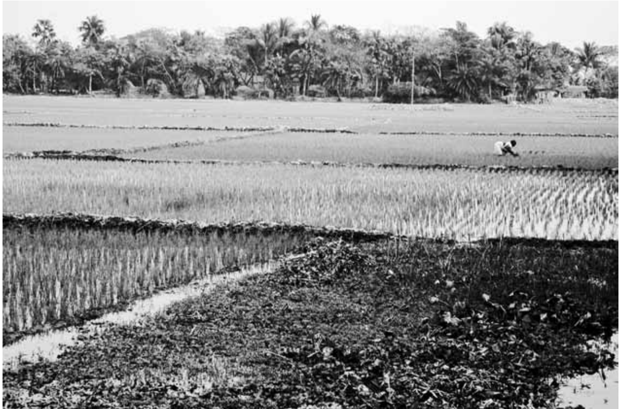
Arrozal fertilizado naturalmente, Morapai, región bengalí, India.

materia orgánica durante el siglo 20, mientras que los suelos que sustentan pastizales y praderas han perdido típicamente hasta 50%. Es indudable que estas pérdidas han provocado un serio deterioro de la fertilidad y productivi-