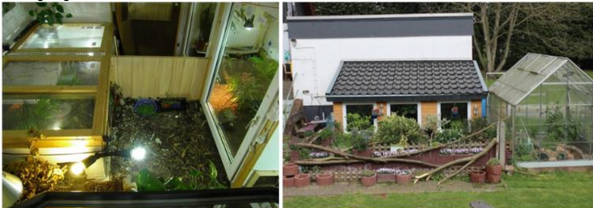
Gehege-Beispiele (Oben links Gehegezimmer / rechts Ganzjahresgehege)

Diese Gehege-Variante beinhaltet ein geräumiges Schutzhaus, was die Tiere im Winter bewohnen. Im Sommer gibt es dann eine direkte Zugangsmöglichkeit vom Schutzhaus aus in den Freilandbereich. Die Voraussetzungen bei der Gestaltung des Schutzhauses sind identisch wie beim Zimmergehege, nur dass hier die Räumlichkeiten des Schutzhauses im Winter verlässlich gut beheizt sein müssen und das Haus die Wärme im Inneren behalten muss . Sprich, es benötigt gute Isolierwerte. Auch in einem externen Schutzhaus benötigen die Tiere im Winter Tagestemperaturen von 25 und mehr Grad. Ein Mindestflächenangebot im Winter pro Tier ist schwer zu beziffern, aber pro ausgewachsenen Tier sollten schon 3 m 2 zur Verfügung stehen – wobei mehr Platz natürlich immer besser ist.