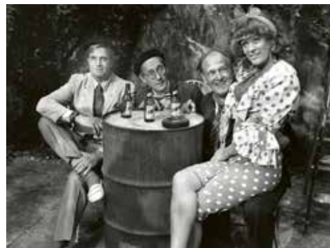
Jönssonligan på Mallorca (1989) Birgitta Andersson med Ulf Brunberg, Gösta Ekman och Björn Gustafson.