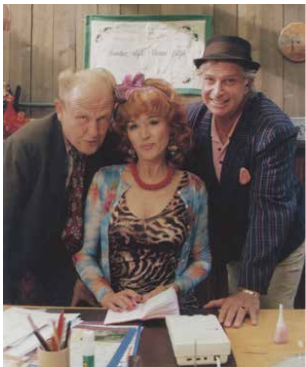
I de många Jönssonligan -filmerna (1981-2000) spelade Birgitta Andersson rollen som smarta Doris. Här med Björn Gustafson och Ulf Brunberg i Jönssonligan spelar högt (2000).