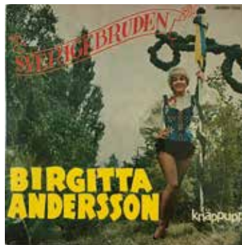
Sverigebruden i Knäppupprebyn, 1962.