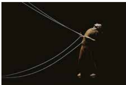
Ur föreställningen Call of the void

Vilda djur som lejon, tigrar eller björnar får inte längre användas i fransk cirkus. Den nya djurskyddslagen gäller även delfinshower. Den som bryter mot lagen kan få upp till fem års fängelse. Det uppger Sveriges Radio Kultur. I Sverige är det sedan 2018 förbjudet att ha med elefanter och sjölejon i cirkusshower, men Djurrättsalliansen vill se helt totalförbud för vilda djur även här.