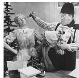
Gumman som blev liten som en tesked, julkalendern 1967 , tillsammans med Carl-Gustaf Lindstedt.